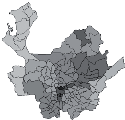
Figura 1. Mapa del departamento de Antioquia, al noroccidente de Colombia.

El municipio de Bello es uno de los diez municipios que conforman el área metropolitana del Valle de Aburrá en el departamento de Antioquia. Limita al norte con el municipio de San Pedro de los Milagros, al oriente con Copacabana, al occidente con Medellín y al sur con Medellín y San Jerónimo.