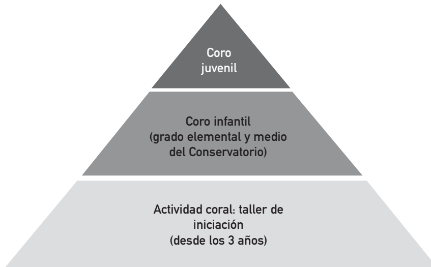
Figura 2. Modelo de coro de niños del Conservatorio.

niños de alguna escuela o algún otro centro. Tras una solicitud de ingreso los alumnos de la propia entidad se incluyen directamente, y solo se hace una prueba a los que vienen de fuera.