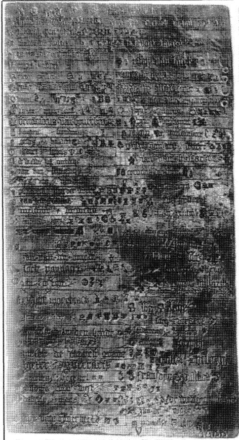
Placa de bronce cos nomes e marcas dos ourives de Gante, 1454 – 1481. Os gremios medievais coas súas normas de ingreso, de produción e de control semellaban verdadeiros colexios profesionais, incluíndo o listado dos seus membros.

É fácil imaxinar a complicación que se produce cando as persoas estudan unha disciplina e traballan noutras actividades, principalmente pola dificultade de encontrar un emprego adecuado ás súas necesidades.