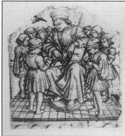
O Mestre de escola. Gravado de Maso Finiguerra, arredor de 1457. As actitudes que se mostran non semellan risco de accidente.

A Lei 4/1999, do 13 de xaneiro, de modificación da LRXAP-PAC, suprime a referencia á responsabilidade civil dos