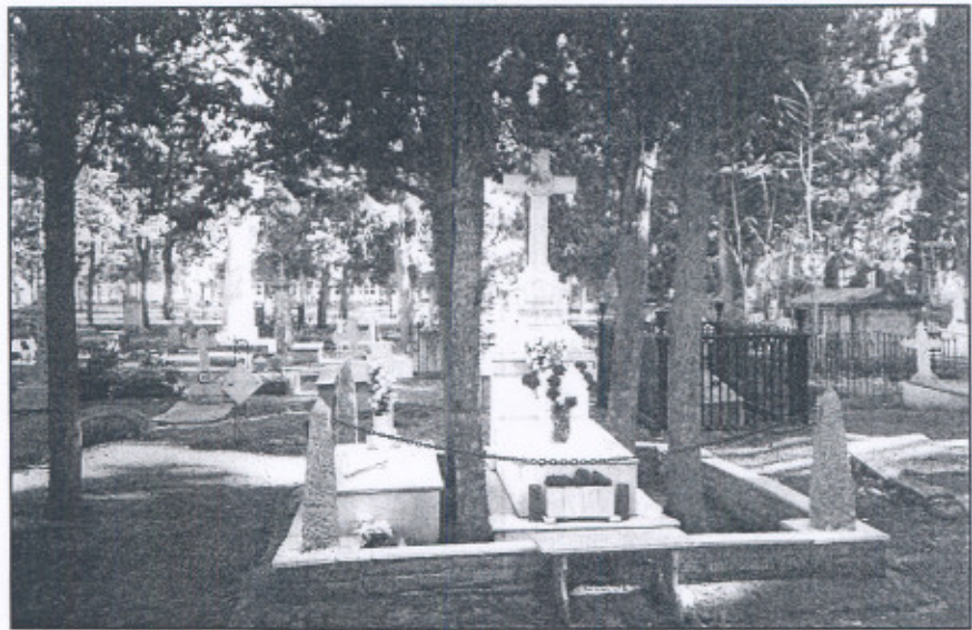
Panteón de la familia Román Puchol en el Cementerio de San José de Granada