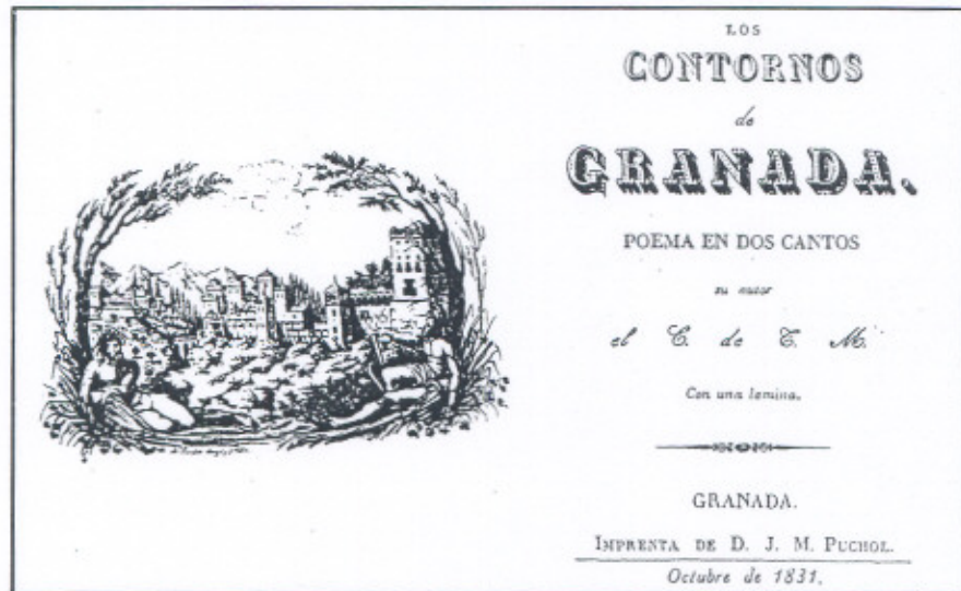
Representación romántica de La Alhambra realizada en la imprenta de Juan María Puchol