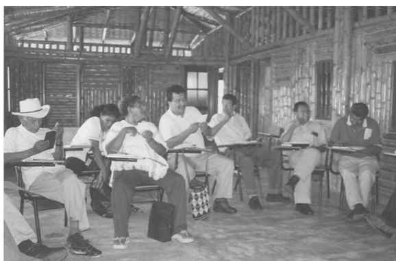
Figura 2. Participantes de la jornada, Casa Cultural Comunidad de Sipirra