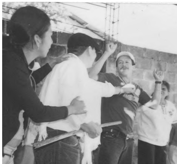
Figura 3. Participantes del proyecto, dramatizando problemáticas con los terratenientes en la comunidad.

en el diseño y desarrollo del plan de vida de la comunidad y en la construcción de referentes identitarios a partir de hechos que han dado forma a las condiciones actuales de la organización (véase figura 3).