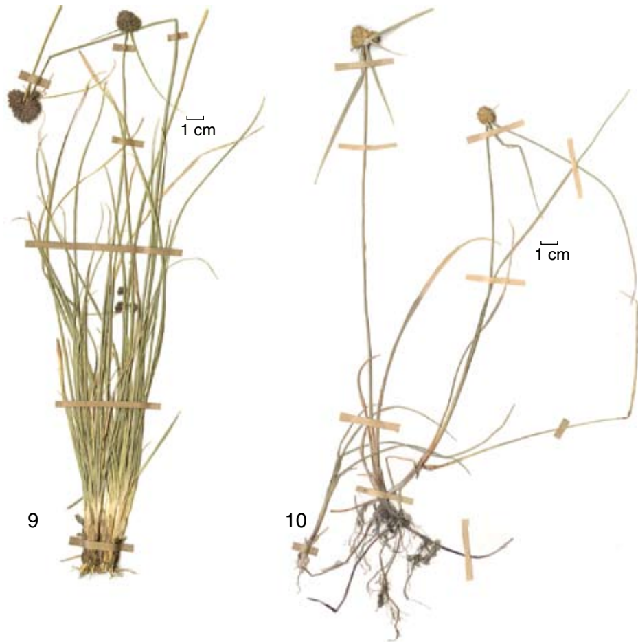
Figs. 9 y 10. 9. Karinia mexicana (Britton) Reznicek & McVaugh. E.D. Enríquez 3083 y M. Adame (CIIDIR). 10. Oxycaryum cubense (Poepp. & Kunth) Palla. R. Fernández y A. Magaña 1064 (CIIDIR).

(ENCB, MEXU), N. Diego 1760 (FCME, XAL), 1771 (FCME, XAL), 5178 (FCME, MEXU), A. Novelo 2236, 2306, 2319, 2578, 2812, 2813, 2847, 2857, 3369 (MEXU), A. Novelo y A. Lot 450 (ENCB, MEXU), V. L. Ramos 00387 (MEXU), L.S. Rodríguez 2083 (IEB) (Fig. 10).