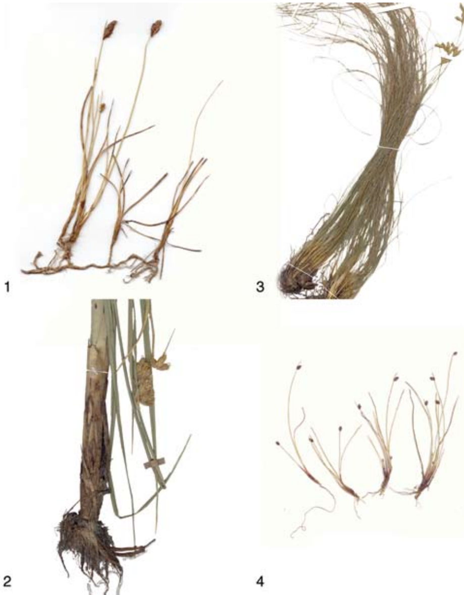
Figs. 1-4. 1. Amphiscirpus nevadensis (S. Watson) Oteng-Yeb. S. González 1010 (CIIDIR). 2. Bolboschoenus maritimus ssp. paludosus (A. Nelson) T. Koyama. Inflorescencia y porción de tallo y hojas, S. Zamudio 11360 y S. González (CIIDIR). 3. Cypringlea coahuilensis (Svenson) M.T. Strong. Inflorescencia y porción de tallo y hojas, Hno. E. Lyonnet 3933 (MEXU). 4. Isolepis cernua (Vahl) Roem. & Schult. Ejemplar, R.F. Thorne et al. 58187 (CIIDIR).