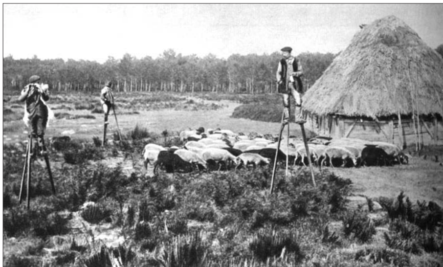
FIG. 4. La représentation des Landes de Gascogne par Cl. Neurdein chez Daniel Faucher: «Autrefois: Bergers landais sur leurs échasses» (FAUCHER; 1951, p. 480).

Le lecteur n'en saura toutefois pas plus sur cette nouvelle entité géographique, le terme ne réapparaissant qu'à l'occasion de quelques lignes consacrées à Saint-Sever: