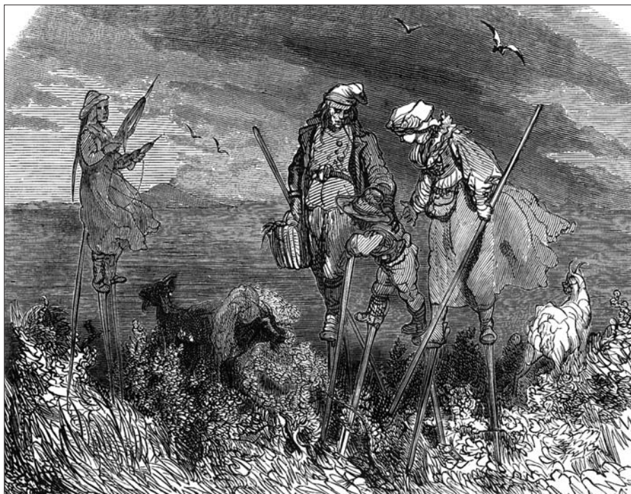
FIG. 2. La représentation des Landes de Gascogne par Gustave Doré dans une réédition de la Géographie universelle de Conrad Malte-Brun: «Paysans des Landes» (MALTE-BRUN; 1860, p. 40).

Dans celle de 1860, les Landes de Gascogne donnent lieu à une gravure de facture romantique, réalisée par Gustave Doré, qui représente un couple de pasteurs sur des échasses, parcourant une lande qui n'a rien de rase et surplombant un troupeau exclusivement de chèvres et non de moutons (Fig. 2).