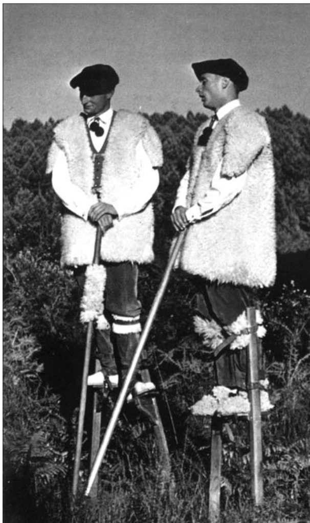
FIG. 6. Les échassiers du folklore contemporain comme évocation de la société traditionnelle dans L'Aquitaine de Serge Lerat (LERAT; 1974, p. 74).

CHER; 1951, p. 480), surtout à l'intérieur des Landes où «il n'y a rien, le vide du désert» (FAUCHER; 1951, p. 481) 12 . Ainsi, il contribue bien à reproduire pour les Landes de Gascogne la rhétorique traditionnelle du désert, défini par Abraham Moles comme «un espace plan illimité, indéfini, "vide" et sans repères, qui outre-