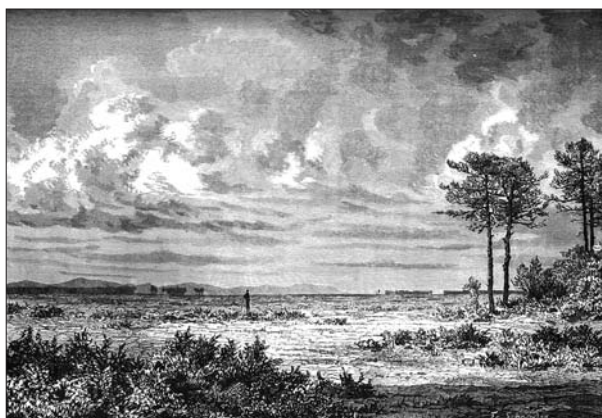
FIG. 3. La représentation des Landes de Gascogne par Franz Schrader dans la Géographie Universelle d'Élisée Reclus: «Une lande» (RECLUS; 1877, p. 97).

Pourtant, l'influence romantique est toujours palpable à travers une gravure de facture classique, d'après un dessin de son cousin Franz Schrader 9 ; celle-ci associe une lande rase à perte de vue à quelques pins maritimes, avec en second plan, «l'inévitable» pasteur landais sur ses échasses (et en arrière plan, la chaîne des Pyrénées) (Fig. 3). Cette image des Landes de Gascogne est très