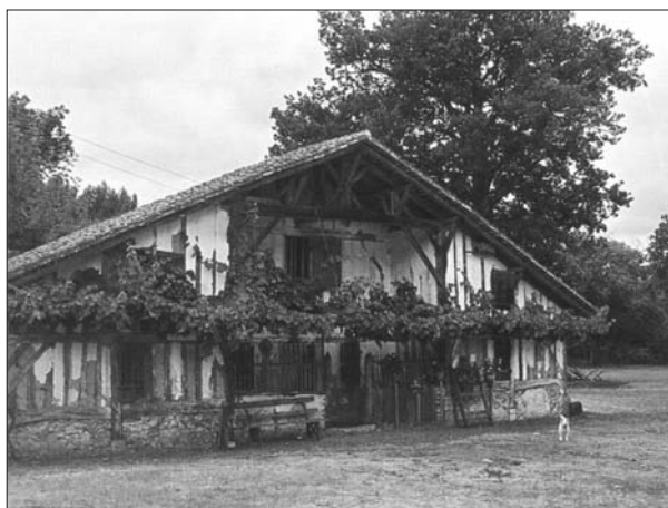
FIG. 5. Une maison ancienne comme artefacts de la société traditionnelle dans Le Midi atlantique de Louis Papy: «Maison de la Grande Lande» (photo originale couleur de Louis Papy) (PAPY; 1982, planche hors-texte).

Ici aussi, la transformation profonde des landes a constitué un facteur très important de progrès, sur le plan économique mais aussi sanitaire, mais un progrès toutefois fragile, dépendant du bon entretien du réseau