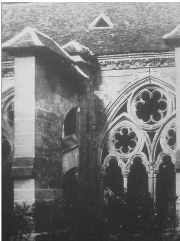
FIG. 5. Henry Le Secq, Cloître de Noyon , 1851. Prueba sobre papel salado a partir de un negativo en papel.

una terraza inclinada. O más aún, en la toma de la vista general de las murallas de Avignon (Fig. 3). En este último ejemplo, Baldus utiliza un montón de maderos como punto de apoyo y una fila de árboles para delimitar su imagen en la parte izquierda, lo que le permite aumentar el efecto de la perspectiva sin desequilibrar la composición. Los panoramas realizados por Baldus gracias al montaje de negativos diferentes, testimonian igualmente la voluntad de mostrar la totalidad de un monumento. Así, la vista de las arenas de Nîmes, que constituye la panorámica más espectacular, permite aprehender, de manera sinóptica, la casi totalidad del edificio, como podría hacerse al girar uno mismo sobre los talones. La multiplicación de los clichés de un solo monumento, haciendo variar las distancias o puntos de mira, como lo hacen G. Le Gray y O. Mestral en Carcassonne por ejemplo, o logrando alternar vistas detalladas y vistas del conjunto, como lo hace H. Le Secq con sus clichés de la catedral de Reims, responde a ese mismo deseo de una toma exhaustiva y global. Las se-