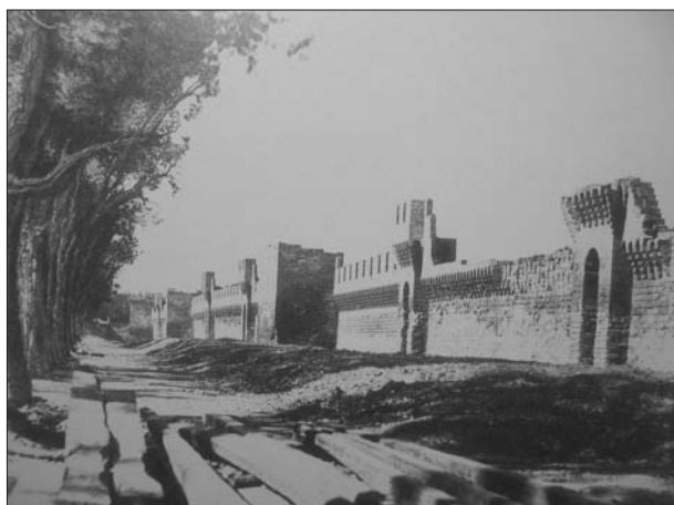
FIG. 3. Edouard Baldus, Remparts d'Avignon , 1851. Prueba sobre papel salado a partir de un negativo en papel gelatina.