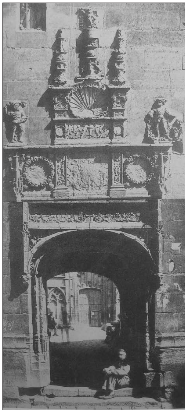
FIG. 2. Edouard Baldus, Porte de l'Archevêché à Sens , 1851. Prueba sobre papel salado a partir de dos negativos en papel.

De hecho, esta misión constituye un gran acontecimiento ya que es el primer encargo de un Estado dirigido a un colectivo de fotógrafos: ésta aparece como el prototipo de todos los encargos ulteriores. Es sin em-