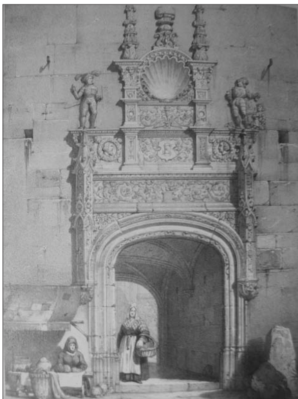
FIG. 1. Dibujo y litografía de Emile Sagot. Porte de l'Archevêché à Sens . Publicado en los Voyages pittoresques et romantiques dans l'ancienne France , 1857, vol. 2, t. 2, pág. 160.

Hubo que esperar a la invención del procedimiento negativo/positivo, la puesta a punto de tirajes sobre papel, la mejora de la calidad de los clichés y la fabricación de un equipo más liviano, para abordar la realización de misiones fotográficas 3 . Por otro lado, 1851 es el año de la creación de la gaceta semanal La Lumière y el año de la creación de la Société héliographique . Estos dos órganos, encargados de asegurar el reconocimiento público del nuevo medio y de militar en su favor, tuvieron un papel activo en la realización de la Misión heliográfica y contribuyeron ampliamente a su notoriedad.