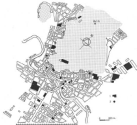
FIGURA 6. Situación de los servicios educativos (1) y culturales (2) en la ciudad de Orihuela.

principal de la Caja Rural Central en la calle Doctor Sarget y las actividades del Aula de cultura de la Caja de Ahorros del Mediterráneo en la calle Cardenal Loaces.