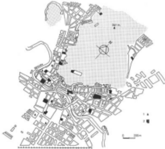
FIGURA 5. Distribución en el núcleo urbano de Orihuela de los servicios sanitario-asistenciales (1) y religiosos (2).

de la Casa-Museo de Miguel Hernández, emplazada en el Arrabal de San Juan, en las inmediaciones del Colegio de Santo Domingo.