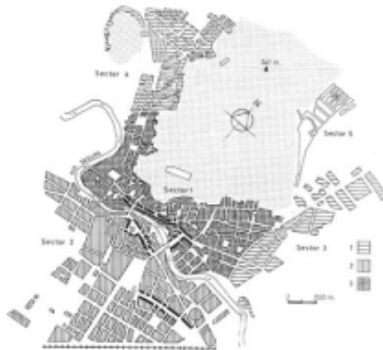
FIGURA 2. Distribución espacial de las actividades comerciales en el núcleo de Orihuela: 1, menos de cien comercios; 2, de 100 a 200; 3, de 201 a 300. En trazo grueso aparecen los principales ejes comerciales, a saber: A, calles de Ramón y Cajal y Alfonso XIII; B, Calle de San Pascual y Plaza Nueva; C, Calle del Duque de Tamames. En punteado, el Monte de San Miguel.