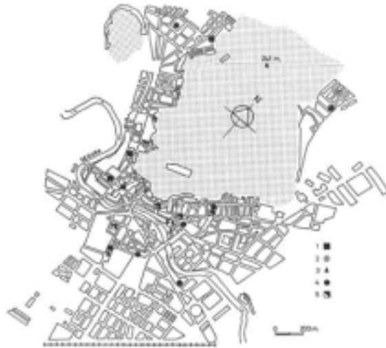
FIGURA 3. Reparto de los servicios administrativos en la ciudad de Orihuela: 1, dependencias municipales; 2, organismos provinciales; 3, servicios de la Generalidad; 4, oficinas del Estado; 5, otras administraciones.

Las restantes Administraciones se emplazan en edificios de factura moderna y reciente construcción, a excepción de la Comisaría de Policía Nacional que lo hace en los bajos del Palacio de Teodomiro, casa nobiliaria de los Condes de Luna, construida en la segunda mitad del siglo XVIII.