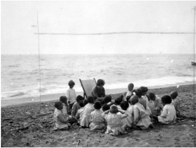
Imagen de los niños de la Escuela del Mar en una sesión en la playa. Encuadre para su publicación

propuestas. La exposición tuvo una gran difusión y levantó un considerable revuelo en Suiza, porque algunos arquitectos, indirectamente, se vieron públicamente cuestionados.