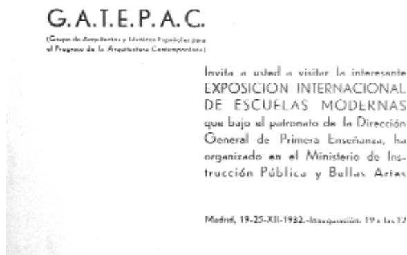
Invitación a la inauguración de la Exposición internacional de escuelas modernas en Madrid, 20 diciembre 1932

Profesor asociado del Departamento de Proyectos Arquitectónicos de la UPV.