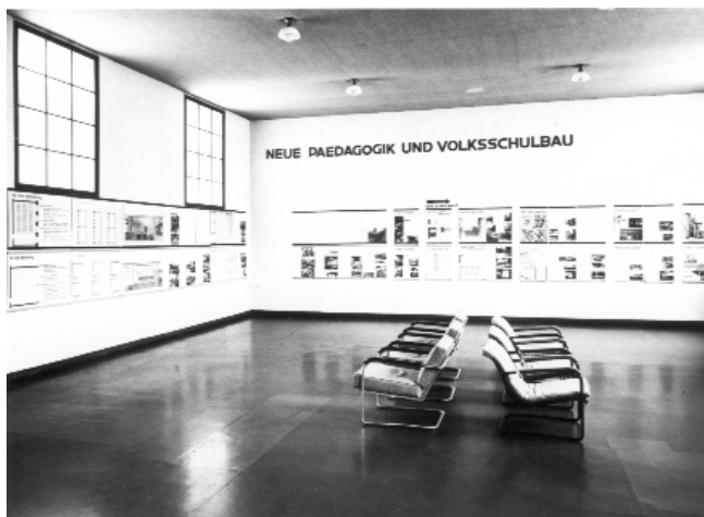
Imagen de la exposición en la sede del Kunstgewerbemuseum de Zürich, 1932