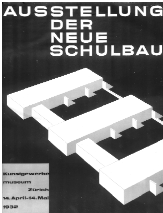
Cartel de la exposición itinerante Der neue Schulbau, en su edición de Zürich.

En el entorno del grupo suizo, el hecho de organizar