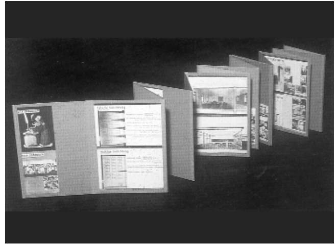
Álbum desplegable realizado por Moser

A pesar de todo, la exposición y los números monográficos sufren un considerable retraso, provisionalmente al menos hasta septiembre de 1932. Retraso que permite que se realice la exposición de Zürich con una gran difusión: en la revista Das Werk de mayo de 1932 aparece un extenso reportaje - treinta y una páginas- y reseña crítica sobre la misma, con profusión de las imágenes y gráficos expuestos. 25 El 9 de junio, Giedion envía una carta a Sert en la que le informa que Neumann ha averiguado que la exposición no se podrá enviar a Barcelona