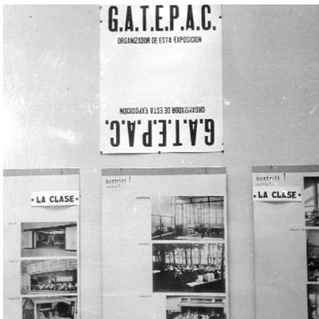
Imagen de la exposición en Madrid, 1932