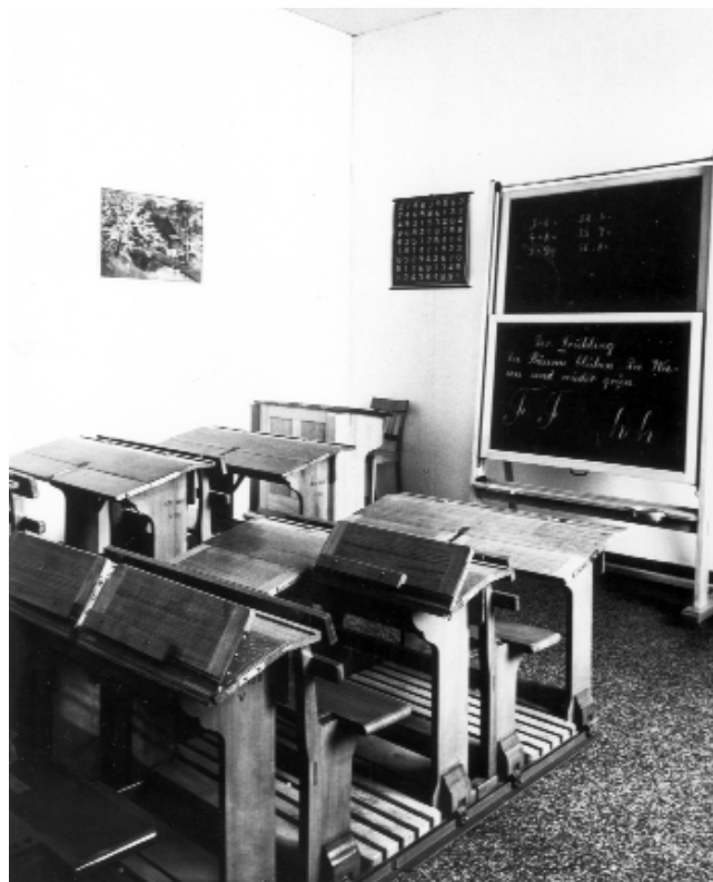
Imagen de la exposición en la sede del Kunstgewerbemuseum de Zürich, 1932