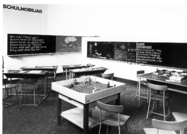
Imagen de la exposición en la sede del Kunstgewerbemuseum de Zürich, 1932