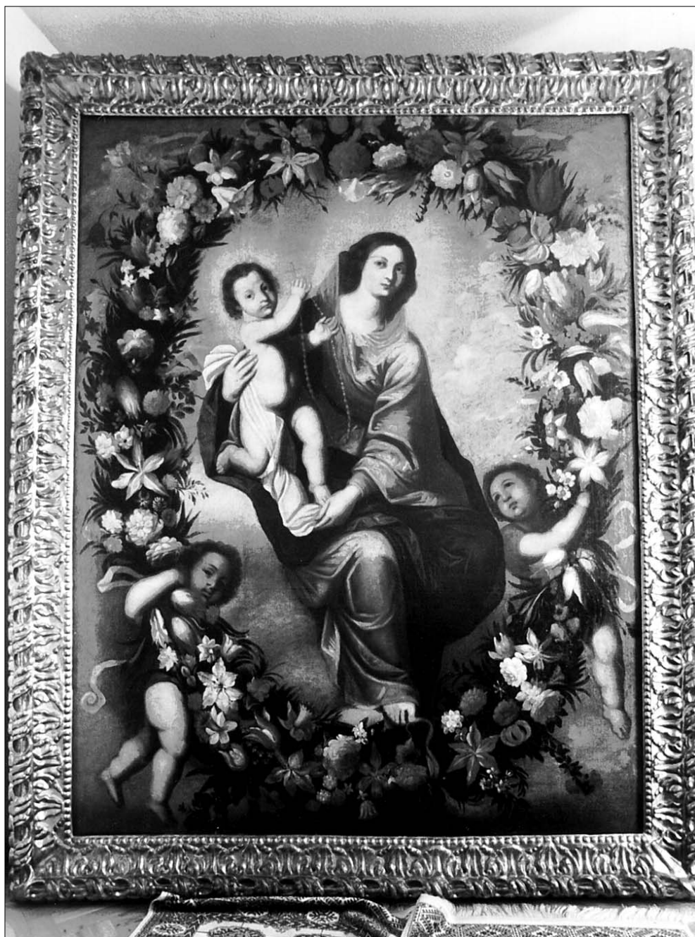
Figura 4. Seguidor gilartesco : «Virgen del Rosario en orla floral». Madrid, colección privada.