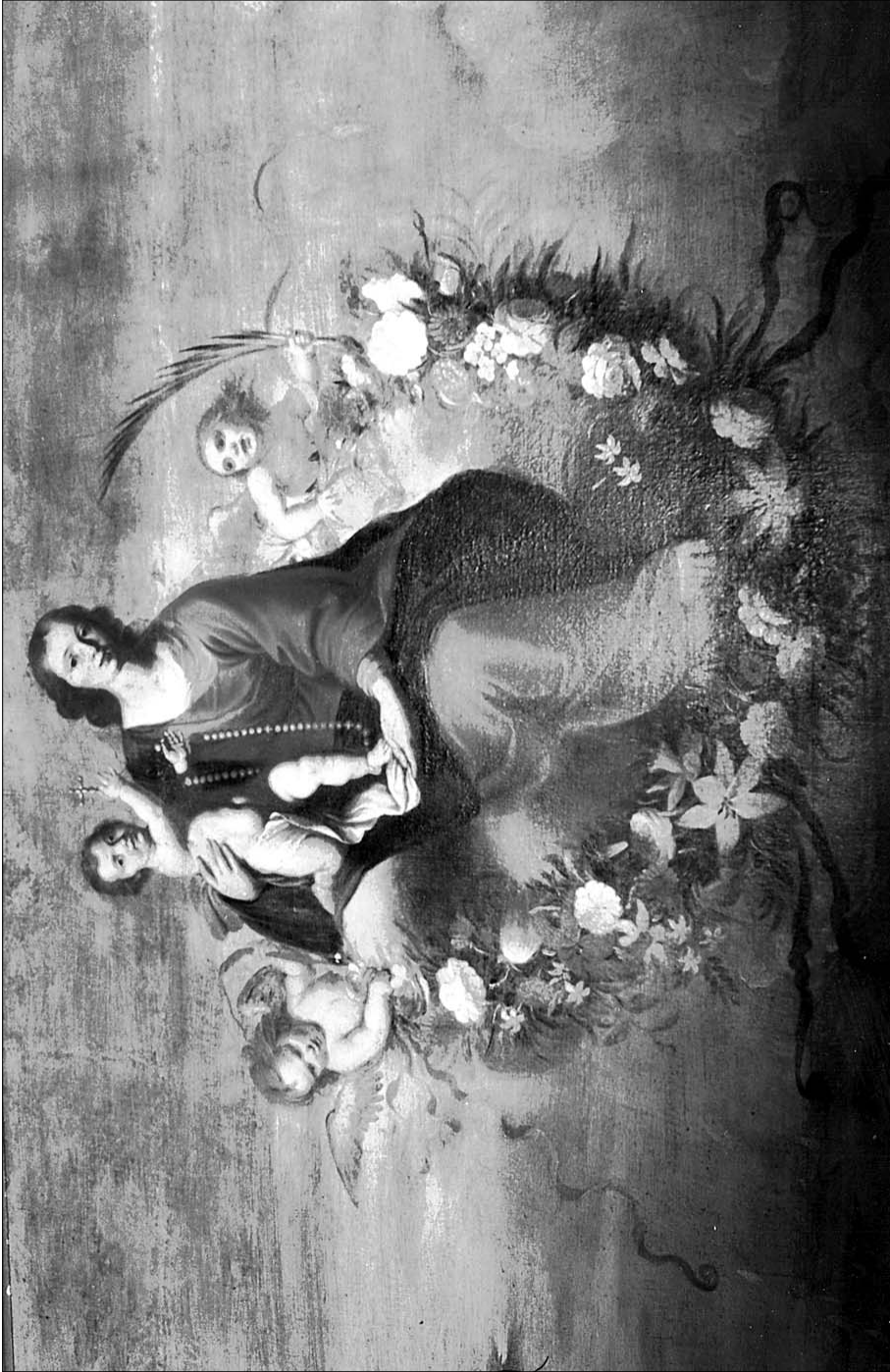
Figura 2. Francisco o Mateo Gilarte: Detalle del grupo de la Virgen del Rosario en la «Batalla de Lepanto». Murcia, Capilla del Rosario, iglesia de Santo Domingo.