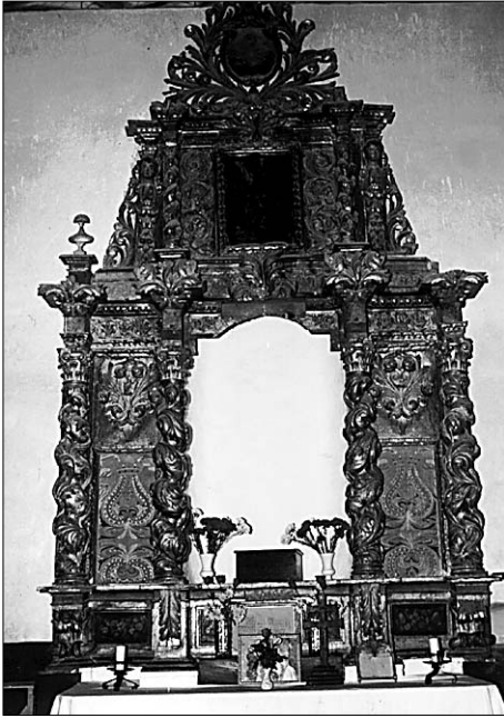
Figura 6. Antiguo retablo mayor.