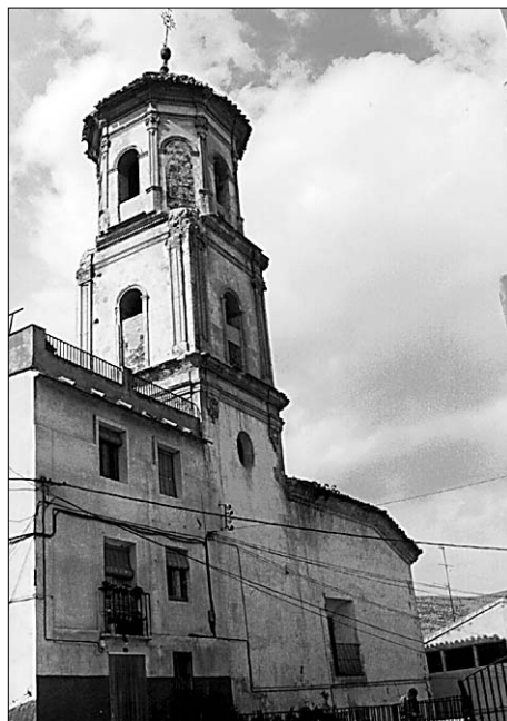
Figura 4. Exterior.

la ventana del camarín antiguo, siguiendo la idea del transparente, separados por pilastras decoradas con un golpe de hojarasca.