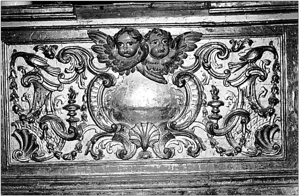
Figura 5. Retablo mayor. Detalle.

enmarcado por una orla tallada y plateada. Sobre la mesa hay un sagrario, ejecutado en Lorca en 1874, según reza la inscripción que aparece en su parte posterior 42 .