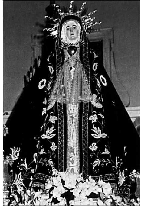
Figura 7. Virgen de la Soledad.