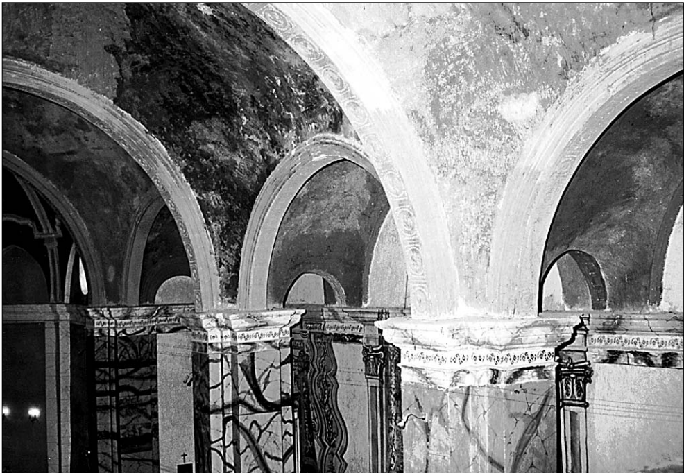
Figura 2. Bóvedas.