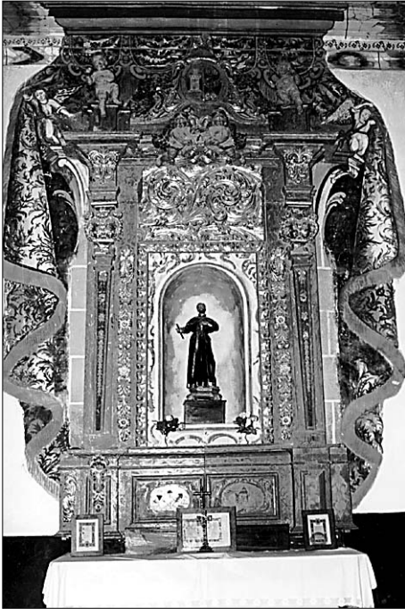
Figura 9. Retablo de San Francisco Javier.