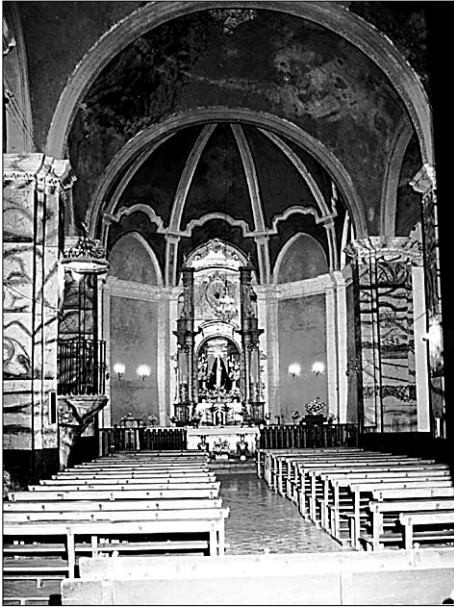
Figura 3. Capilla Mayor.

materiales de la ermita. Tras la columna hay un modesto cancel de obra que da paso a la puerta principal de la iglesia, cuyas puertas se hicieron en 1637 11 .