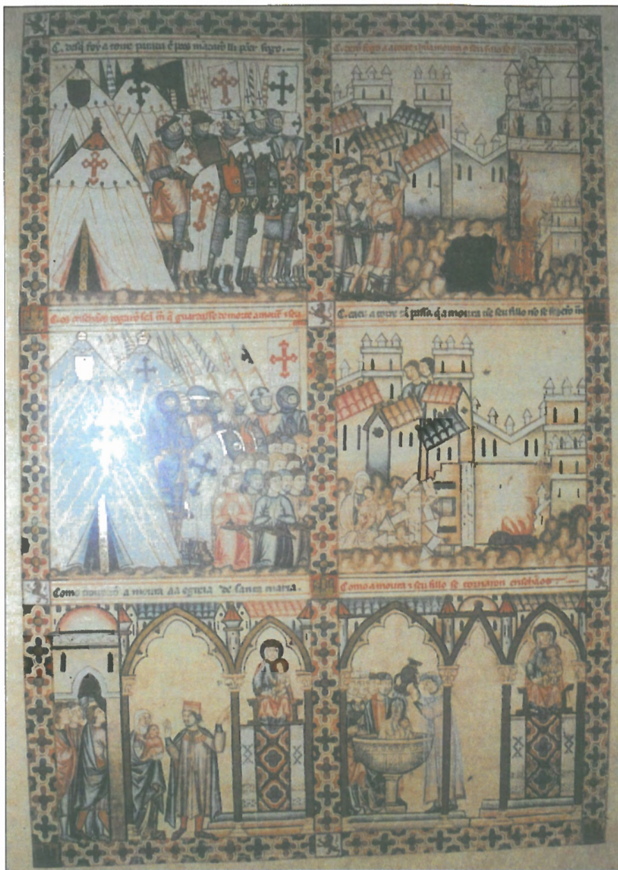
1. Cantiga 205, Códice de Florencia, f. 6r.