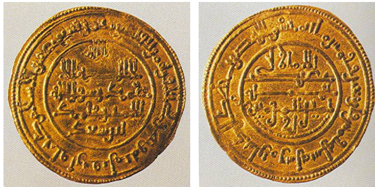
Figura 2: Dinar Ceca Murcia, 554 hégira

Dihrem , en lo que han dado en llamarse sistemas bimetálicos (como antaño lo fue el romano) que exigían una relación estable de cambio o equivalencia entre ambos metales.