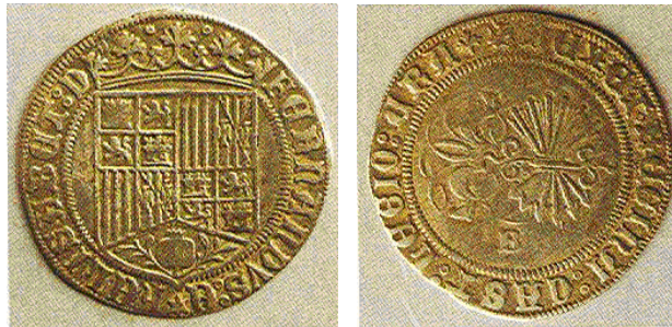
Figura 9: Real de Plata, de los Reyes Católicos, posterior a la Pragmática de Medina del Campo. Acuñada en Burgos "B", circuló en León con posterioridad a la pragmática. Museo de León, nº Inventario 2462

Para el metal argénteo mantendrán el real (tallando 77 piezas por marco), pero cambiando la tipología con el simbolismo del Yugo y las flechas entrelazados en su anverso y fundiendo en reverso en un escudo integrado las armas de Castilla y Aragón, que acababa con el tipo del primer real que acuñaron, indudablemente "medieval", que labraron con heráldica de un reino en anverso y del otro en reverso: " i que en los reales se ponga de una parte nuestras armas reales (ya unificadas) e de otra las devisas del yugo de mi la reina i la devisa de las frechas de mi el rey ".