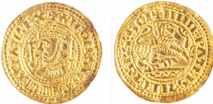
Figura 4: Anversos del maravedí de oro de Alfonso IX de León

nº inventario 1973/24/17005.