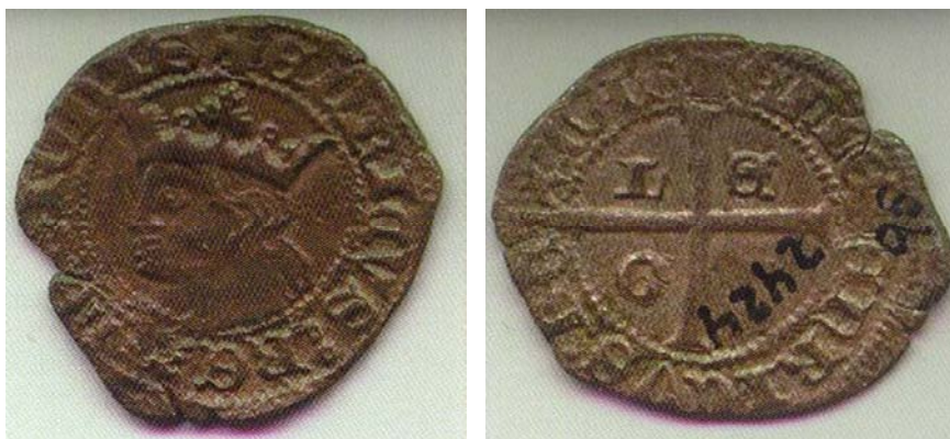
Figura 8: Cruzado 1369-70 valor 1 maravedí. Acuñado en León: L/E/O/N. Museo León, n° Inventario: 2424b

Además en el tiempo de Enrique II se crearon nuevas monedas, fundamentalmente el cruzado en 1369 al que en principio se dio un valor de un maravedí.