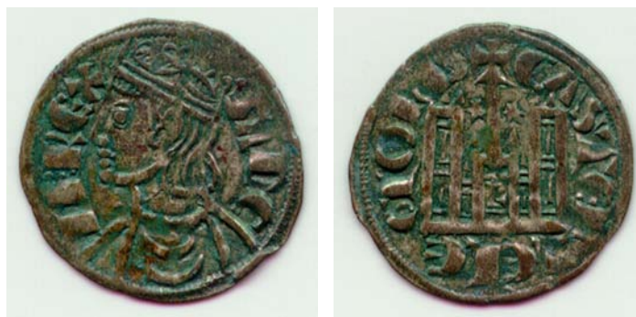
Figura 6: Sancho IV Cornado, anverso y reverso ceca de León. Museo de León, nº 1992-15,II,64

Siguiendo el hilo de nuestro discurso, podemos decir que a pesar de su excentricidad en el espacio unificado de León y Castilla, cada vez más amplio por los avances de la reconquista y la reunificación, sí conserve un cierto protagonismo desde finales del XIII y principios del XIV, buena prueba de ello es su activa presencia en las hermandades de las minorías de Fernando IV y Alfonso XI: Diversas villas leonesas participan en la hermandad leonesa de 1282 con Sancho IV, en la de las Cortes de Valladolid de 1295, en la hermandad leonesa de seguridad de 1312, en una hermandad política sumamente restringida con los infantes don Juan y don Felipe en 1313 -con tan solo León, Zamora, Astorga, Benavente y Mansilla- y en la general de 1315 (Fuentes Ganzo 1998c).