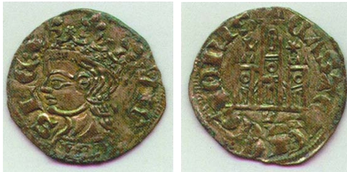
Figura 7: Cornado Alfonso XI León. Museo de León, Junta de Castilla y León, nº 1992,15,IV-225

La llegada al trono de Enrique II, y sobre todo la guerra civil entre petristas y trastamaristas (1366-69) que se saldó con la muerte de Pedro I a manos del propio Enrique II en los campos de Montiel, trajo un marasmo monetario a Castilla que no se conocía desde los tiempos de Alfonso X, siendo en nuestra opinión una de las cuatro grandes crisis con brutales quiebras monetarias de León y Castilla a lo largo de los siglos medievales, a saber: