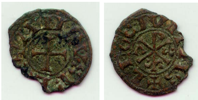
Figura 1: Obolo de Vellón (divisor del dinero) acuñado por Alfonso VI en León ca. 1080

Cortesía del Museo de León, Junta de Castilla y León, nº inv. 2454.