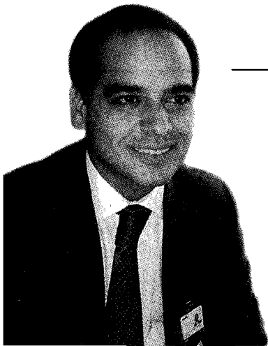
Andrés Izarra, Presidente de Telesur

La noticia, lógicamente, levantó inmediatas reacciones y pronunciamientos. A las 23h59 del domingo 27 de mayo de 2007, el canal pionero de la televisión venezolana cesó en sus transmisiones. Sin embargo, el tema del permiso de transmisión para RCTV no puede verse aislado, y es necesario ubicarlo en un contexto mediático mayor: la constitución de una hegemonía comunicacional por parte del gobierno del presidente Hugo Chávez, especialmente en materia de medios radioeléctricos.