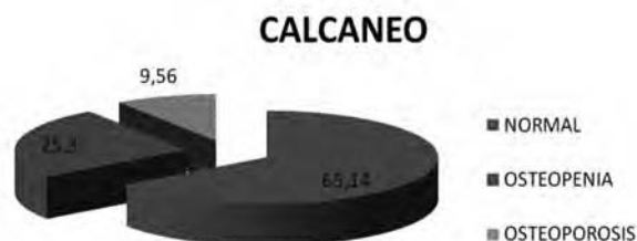
Gráfica 3. Porcentaje de trabajadores según DMO en calcáneo

die (gráficas 3,4 y 5), de manera que en calcáneo es de un 34,86% (9,56% de osteoporosis y 25,3% de osteopenia), en columna lumbar es de un 34,69% (7,48% de osteoporosis y 27,21% de osteopenia), y finalmente en cuello de fémur es de un 34,01% (2,72% de osteoporosis y 31,29% de osteopenia).