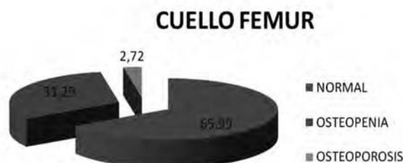
Gráfica 5. Porcentaje de trabajadores según DMO en cuello de fémur