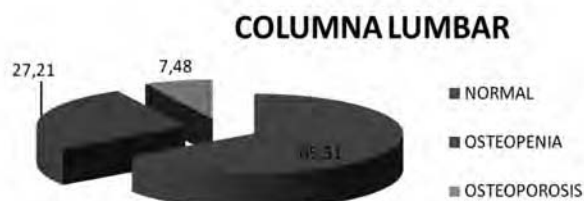
Gráfica 4. Porcentaje de trabajadores según DMO en columna lumbar