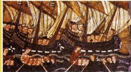
Fragment del retaule dedicat a santa Úrsula (Convent de Sant Francesc, Palma)