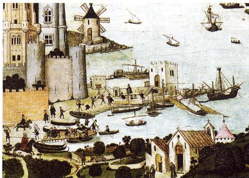
Puerto de Palma según Pere Niçard. Museo Diocesano de Mallorca

De los 37 años del reinado de Fernando el Católico sólo 10 – un 27% - conocieron cosechas suficientes para satisfacer las necesidades de consumo de la población insular: 1482, 1491, 1498, 1500, 1508, 1511, 1512, 1513, 1514 y 1517.