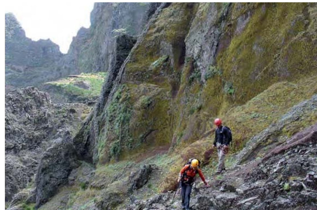
Acceso a la colonia "Life", la más reciente, que fue descubierta en 2003.

Al igual que ha ocurrido en tantos otros lugares del mundo después de la llegada del hombre, la introducción de herbívoros y depredadores en Madeira ha provocado la degra-