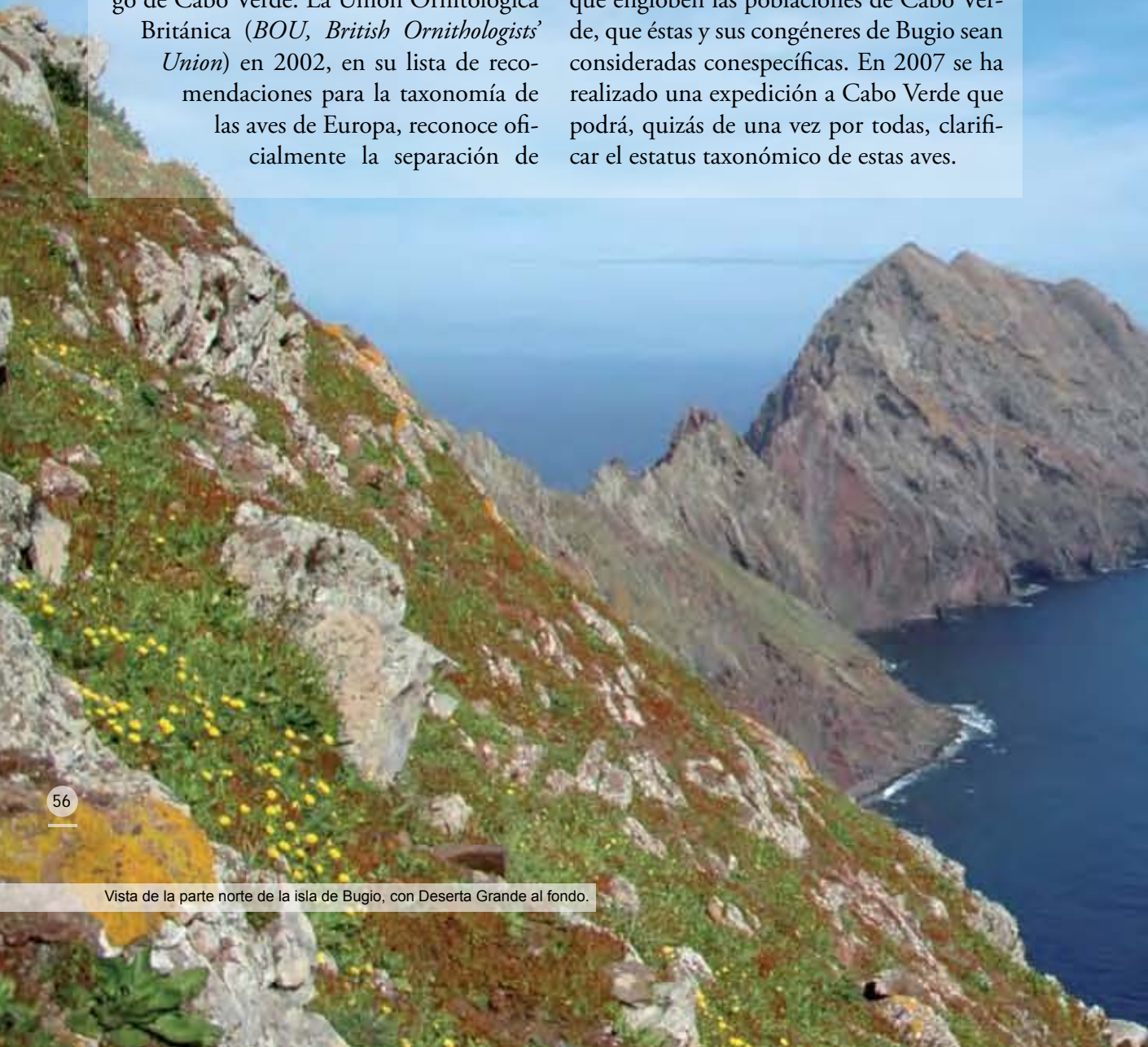
Vista de la parte norte de la isla de Bugio, con Deserta Grande al fondo.

Durante la época de reproducción de 2006 se identificaron cerca de 140 nidos potenciales, de los cuales 119 fueron ocupados (datos no publicados de los autores), lo que se traduce en una estimación poblacional considerablemente inferior a la efectuada para 2001 (de 173 a 258 parejas [Geraldès, 2002]). De todas formas, creemos que esta diferencia no significa un declive real de la población, sino una