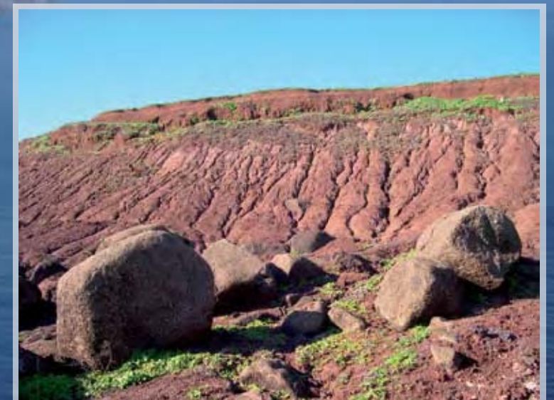
Evidencias de erosión en el "Planalto" o planicie sur de Bugio, cuyo origen está en la desaparición de la vegetación provocada por los conejos, ratones y cabras introducidos.