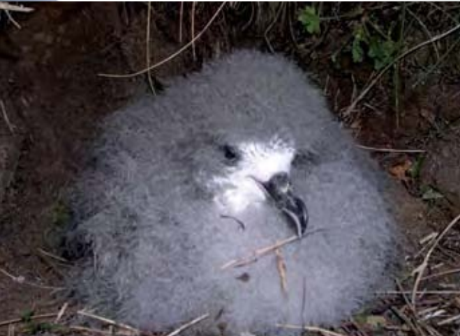
Pollo de P. madeira .

aves estén expuestas a amenazas todavía no identificadas, y que de alguna manera éstas puedan condicionar su continuidad futura. Además, la taxonomía de las diferentes especies/poblaciones que nidifican en la Macaronesia no es aún suficientemente conocida, por lo que podríamos subestimar el grado de conservación de estas especies.