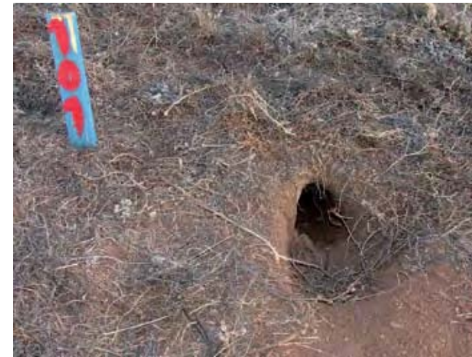
El nido de P. feae es excavado en el suelo, pudiendo alcanzar los dos metros de profundidad.

El petrel freira llega al macizo montañoso central en marzo, para proceder a la limpieza y preparación del nido, en paralelo con el emparejamiento y la cópula. El éxodo previo a la puesta se da a partir de mediados-finales de abril, y el periodo de puesta se inicia a mediados de mayo. La incubación se efectúa de forma alterna por los dos miembros de la pareja, quedando siempre un ave en el nido, mientras que la otra se va a alimentar. La eclosión ocurre a partir de mediados de julio y la fase de crecimiento se prolonga hasta mediados de octubre. Durante esta última fase los juveniles se quedan en el nido y son