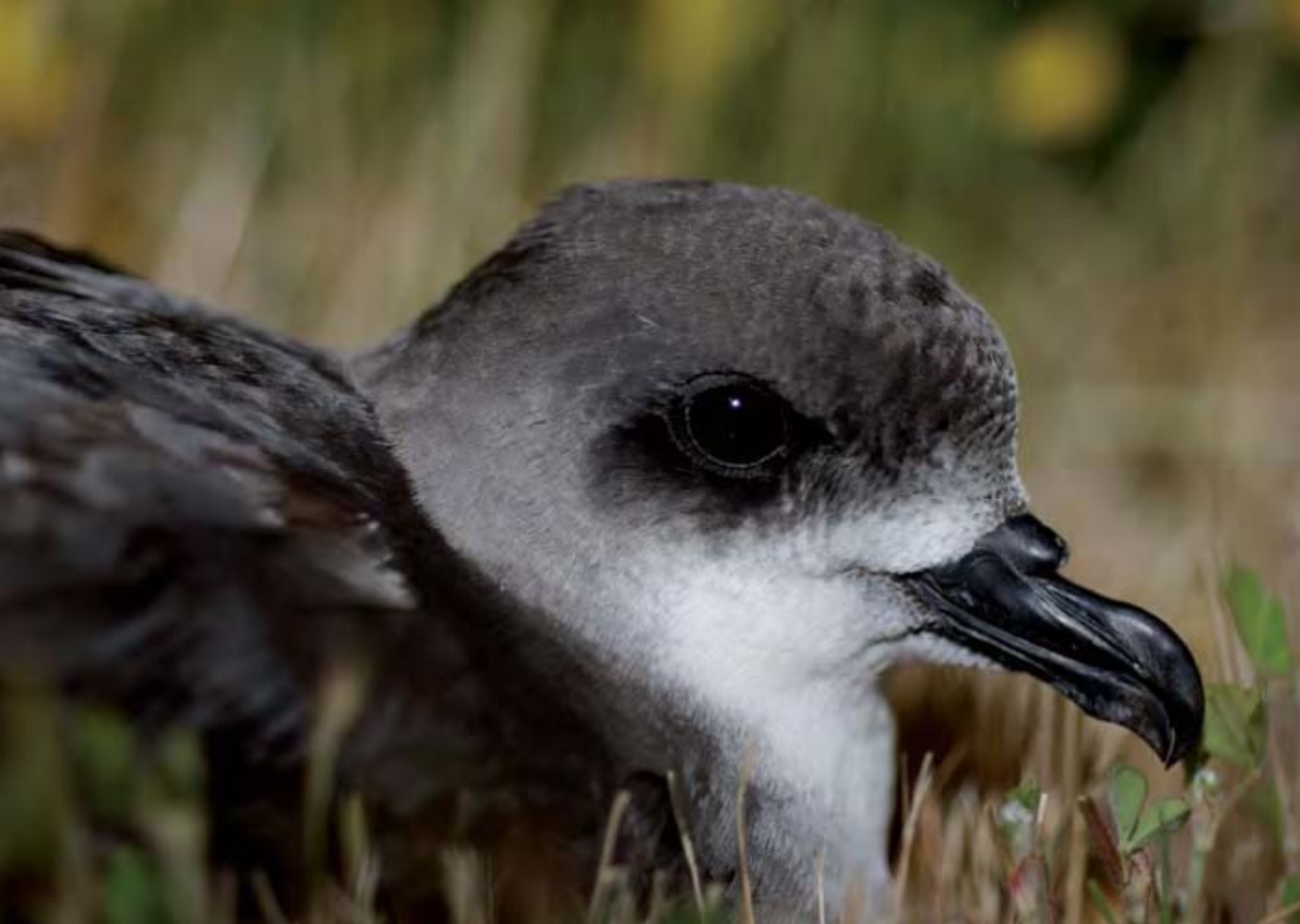
Pterodroma madeira en tierra durante la época de reproducción.

alimentados por los padres, que hacen visitas alternas y cada vez más espaciadas, hasta que el juvenil adquiere capacidad de vuelo. No existen datos concretos sobre la edad de la primera reproducción, que probablemente ocurre a los 4 o 5 años de edad.