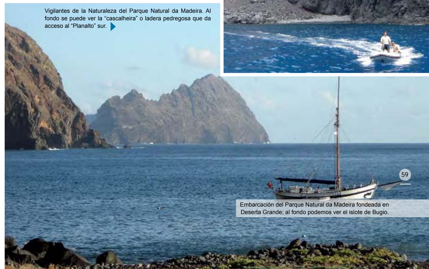
Embarcación del Parque Natural da Madeira fondeada en Deserta Grande; al fondo podemos ver el islote de Bugio.