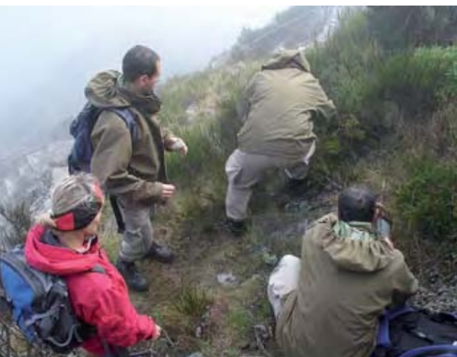
Vigilantes de la Naturaleza y biólogo del Parque Natural da Madeira verificando las trampas para la captura de gatos, distribuidas a lo largo de toda el área de nidificación de la "freira de Madeira".