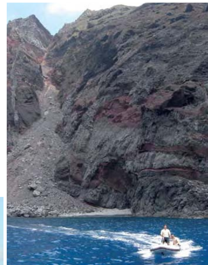
Vigilantes de la Naturaleza del Parque Natural da Madeira. Al fondo se puede ver la "cascalheira" o ladera pedregosa que da acceso al "Planalto" sur. ▶

En el archipiélago de Madeira el petrel gon-gon nidifica casi exclusivamente en una pequeña altiplanicie o cerro, con una superficie aproximada de 2,2 ha, en la isla de Bugio, que se caracteriza por la existencia de suelos relativamente profundos, que facilitan la excavación de los túneles donde nidifica.