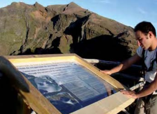
La información al público es una de las prioridades del proyecto de conservación de la "freira de Madeira", a través de la recuperación de su hábitat.