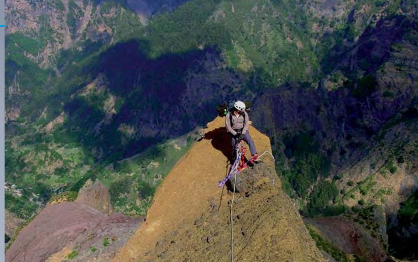
Escalador del Parque Natural da Madeira efectuando trabajos de prospección de nuevas áreas de nidificación, dentro de la zona potencial de ocupación de la especie.

Estas dos especies se encuentran incluidas en el anexo I de la Directiva Aves y en el anexo II del Convenio de Berna. Por lo que respecta a sus áreas de nidificación, ambas están íntegramente clasificadas como Zonas de Especial Protección para las Aves (ZEPA) y Lugares de Interés Comunitario (LIC). El macizo montañoso oriental está integrado en el Parque Natural da Madeira, con estatus de Reserva Geológica y de Vegetación de Altitud. Por su parte, la isla de Bugio es parte de la Reserva Natural de las Desertas, con la categoría de Reserva Integral. Cualquiera de estas áreas tiene además la catalogación de Área Importante para las Aves, IBA ("Important Bird Area"), definida por BirdLife International.