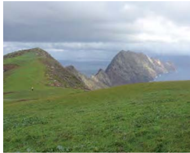
"Planalto" sur de Bugio; al fondo se puede observar el "Planalto" norte y el islote de Deserta Grande.