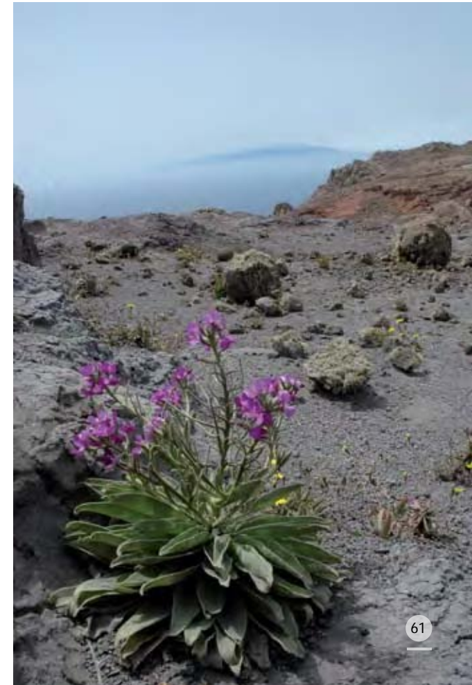
Matthiola madeirensis , planta endémica del archipiélago de Madeira, cuyas semillas están siendo dispersadas en el "Planalto" sur de Bugio.