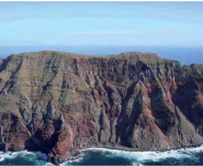
Vista aérea del "Planalto" sur de Bugio. La inaccesibilidad de la colonia es evidente.