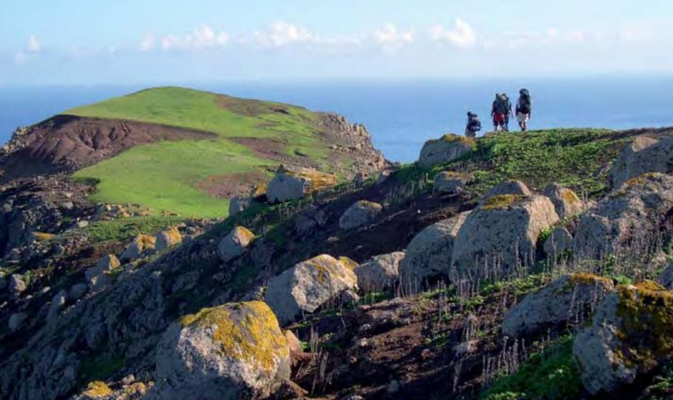
"Planalto" sur de Bugio, donde se encuentran los nidos de Pterodroma feae . Los efectos de la erosión son aquí evidentes.

clara mejoría en la metodología de verificación de los nidos, concretamente a través de un mayor esfuerzo de campo y de la utilización de una sonda de infrarrojos ("burrowscope"), que ha permitido eliminar algunos de los errores subyacentes a las estimaciones anteriores. En este