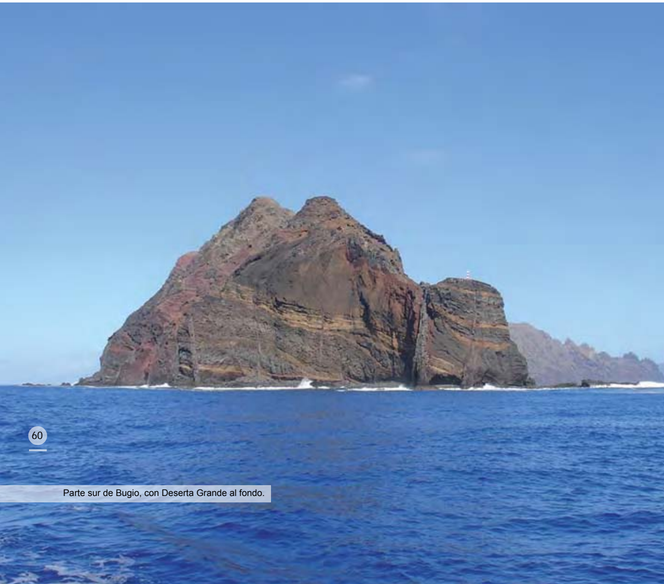
Parte sur de Bugio, con Deserta Grande al fondo.

Para cualquiera de estas dos especies, la distancia entre la entrada del nido y la cámara donde es depositado el huevo varía notablemente, pudiendo llegar a ser muy larga (en el caso del petrel gon-gon puede ser superior a 2 m). Aparentemente, la profundidad del nido se relaciona con la edad de la pareja que lo utiliza, de manera que las aves más jóvenes crían en nidos menos profundos, que van siendo excavados a lo largo de sucesivas épocas.