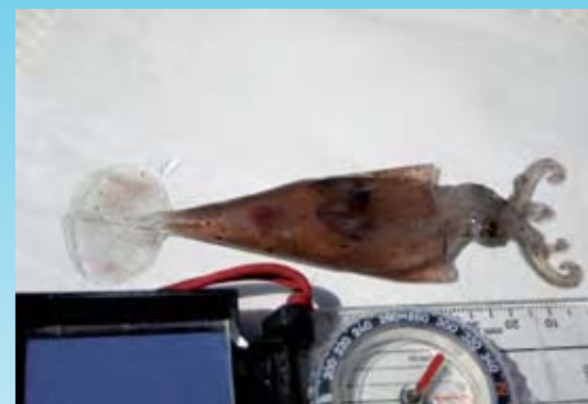
Posible presa del calderón de aleta corta encontrada durante la campaña de estudio en el lugar donde se recogían datos de un grupo de estos cetáceos. SW de Tenerife.

• Zifios y sonares militares: Uno de los impactos humanos sobre los cetáceos más conocidos en Canarias es el de los varamientos masivos de zifios en relación a maniobras navales. En muchas de ellas se utilizaron so-