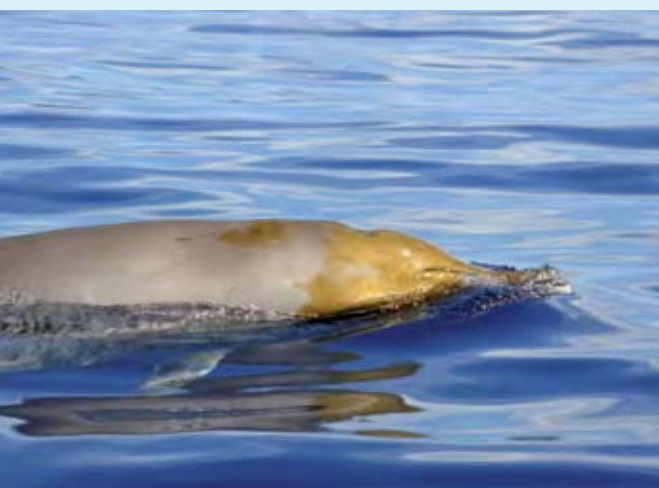
Hembra o subadulto de Mesoplodon densirostris . El Hierro.

que tradicionalmente se aceptaba que los grandes barcos emitían principalmente en bajas frecuencias y, por tanto, su impacto se suponía limitado a los cetáceos con barbas (misticetos), que se comunican en esos rangos. La causa de que el ruido del buque alcance también las frecuencias medias y altas se relaciona con el incremento de la velocidad de los barcos, que provoca una mayor cavitación del motor.