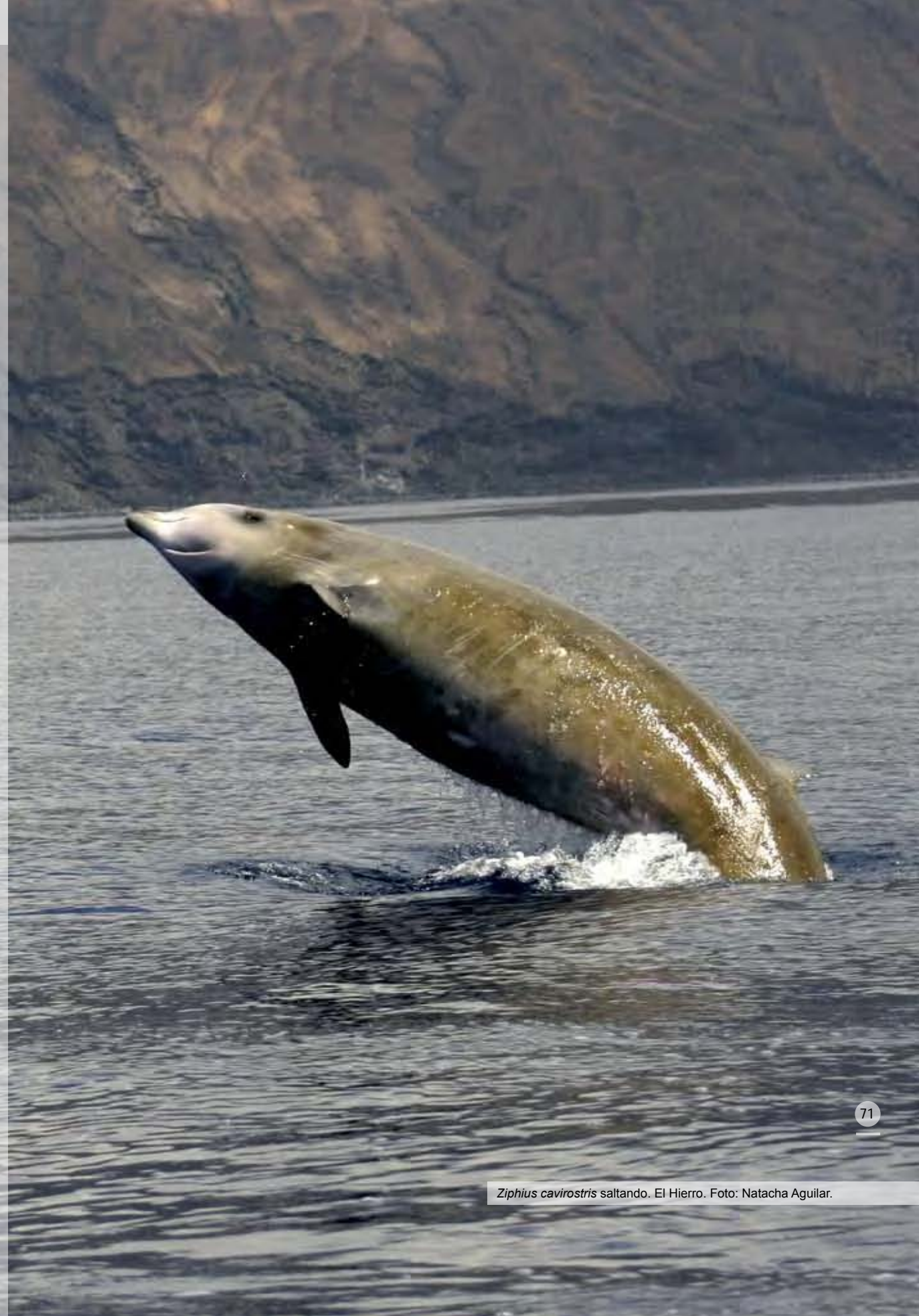
Ziphius cavirostris saltando. El Hierro.

Con el ánimo de contribuir al conocimiento de estos animales, de su magnífica adaptación al medio de aguas profundas y de cómo ésta puede ocasionar una distinta sensibilidad ante factores de impacto antrópicos, en 2003 se inició una nueva línea de investigación de cetáceos de buceo profundo en Canarias. Ésta se desarrolla por medio de un convenio establecido entre la Universidad de La Laguna (ULL) y el Instituto Oceanográfico Woods Hole (WHOI), que permitió presentar proyectos conjuntos y utilizar la mejor tecnología disponible en la actualidad para este objetivo: las Dtag, unas marcas digitales que se adhieren por ventosas al lomo de los animales (figura 1). El Dr.