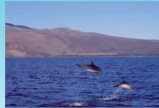
Delfines mulares en El mar de las Calmas. Durante el estudio de zifios en El Hierro también tomamos datos de los delfines mulares de la zona, si éstos se encontraban en nuestra área de estudio.

Hemos visto que los calderones y zifios dependen del sonido para alimentarse, y también lo utilizan para la socialización, detección de depredadores, etc. Estas fun-