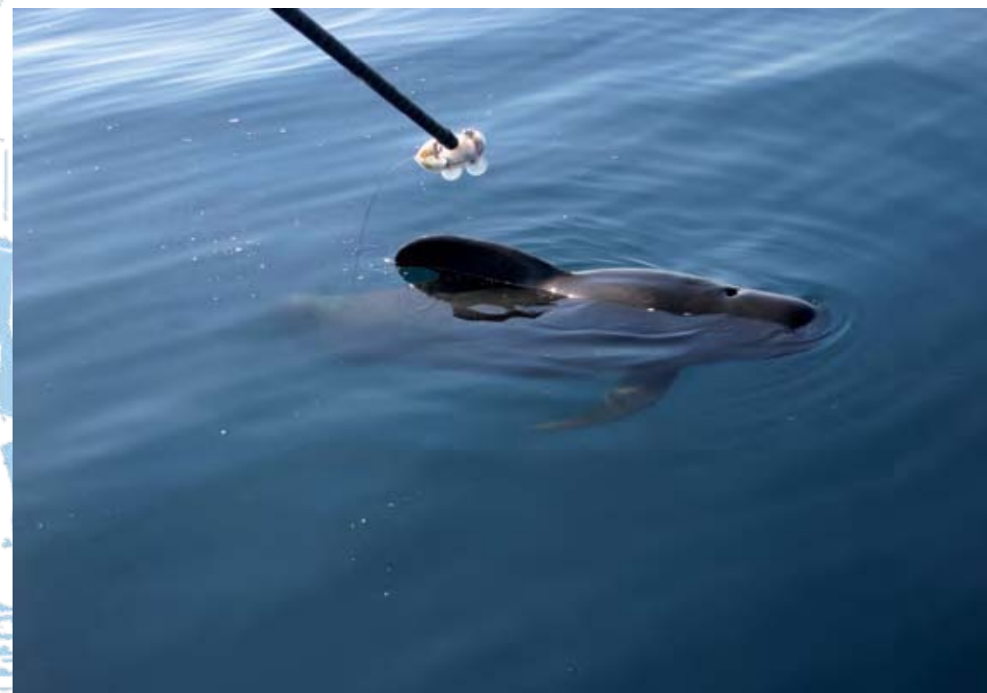
Acercamiento a los calderones de aleta corta para la colocación de D-Tags con ventosas sobre su lomo.

del mundo donde se ha producido un mayor número de estas mortandades. En los últimos casos claros registrados en las islas, en 2002 y 2004, se observó que los zifios varados, con amplias hemorragias internas, presentaban embolias grasas y gaseosas. Este importante descubrimiento, realizado por el equipo de veterinarios de la Universidad de