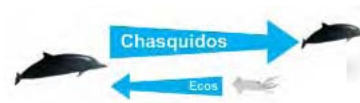
Figura 2: Esquema del uso del sonido para la comunicación (emisor-receptor) y para la ecolocalización (emisor-objetivo/eco-emisor), del que dependen para su supervivencia los cetáceos con dientes. Se muestran los diferentes rangos de alcance para una señal que tuviera la misma intensidad, en un ambiente silencioso. El ruido ambiente se interpone como una cortina de “niebla” acústica que reduce la distancia a la que pueden llegar las señales sonoras, es decir, a la que los cetáceos pueden escucharse unos a otros y encontrar su alimento.

de vivir en pequeños grupos muy unidos, se mantienen prácticamente en silencio en superficie, comenzando y finalizando la emisión de chasquidos a profundidades medias de 470 m y 740 m en el descenso y ascenso, respectivamente, de sus largos buceos de alimentación. Éstos tienen una duración y profundidad media y máxima de 45 minutos/1 hora y 800/1.260 m (en los 29 buceos registrados en los siete zifios de Blainville estudiados con Dtag). Los buceos