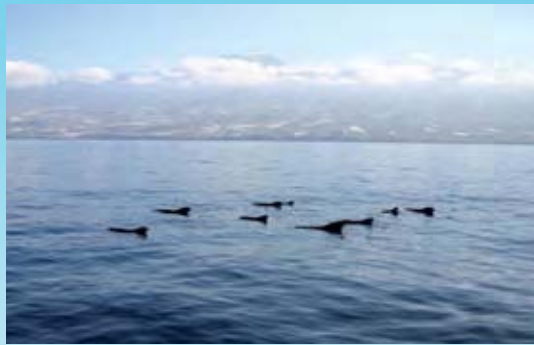
Grupo de calderones de aleta corta ( Globicephala macrorhynchus ) durante su estudio en el suroeste de Tenerife.

El tamaño comparable de los calderones y los zifios que habitan en Canarias, sumado a sus hábitos comunes de alimentarse de presas de profundidad, ofrece la oportunidad privilegiada de realizar aquí un estudio comparativo acerca de cómo las distintas especies han adaptado su comportamiento a retos ecofisiológicos comunes. Podría esperarse que lo habrían hecho de forma similar, dado que parten de ancestros comunes y sufrieron las mismas presiones evolutivas, pero los escasos datos existentes de observaciones de su comportamiento en superficie indicaban lo contrario. Además, los zifios parecen ser mucho más sensibles a algunos impactos humanos, por ejemplo a las maniobras navales con uso de sonares, y esto podría relacionarse con su comportamiento de buceo. Cuando comenzamos este trabajo, en 2003, los zifios eran grandes desconocidos; sólo existían datos de los patrones de inmersión del zifio calderón de hocico boreal ( Hyperoodon ampullatus ), una de las más de 20 especies de zifios conocidas, y no había prácticamente datos sobre las vocalizaciones o la sensibilidad acústica de la familia. Y ello a pesar de que los zifios son los cetáceos más abundantes en los múltiples varamientos masivos que se han registrado en el mundo, relacionados con causas acús-