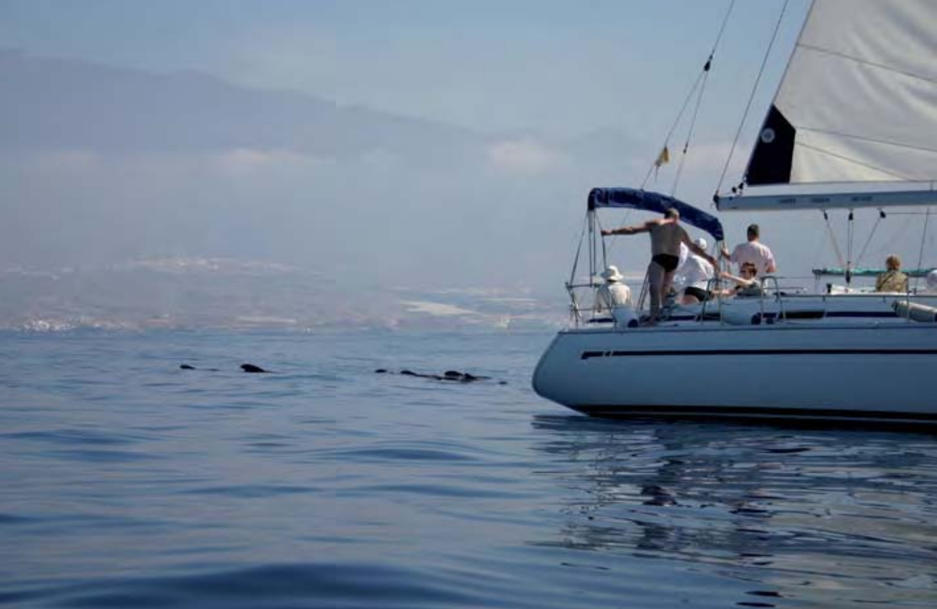
Observación comercial de calderones tropicales en el suroeste de Tenerife.

Blainville, observándose que se comportan de modo completamente distinto. Los calderones tardan una cuarta parte del tiempo que un zifio en realizar un buceo profundo,