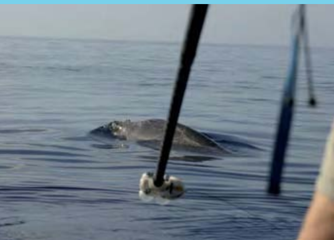
Momento de pre-marcaje de un macho adulto de Mesoplodon densirostris . El Hierro.