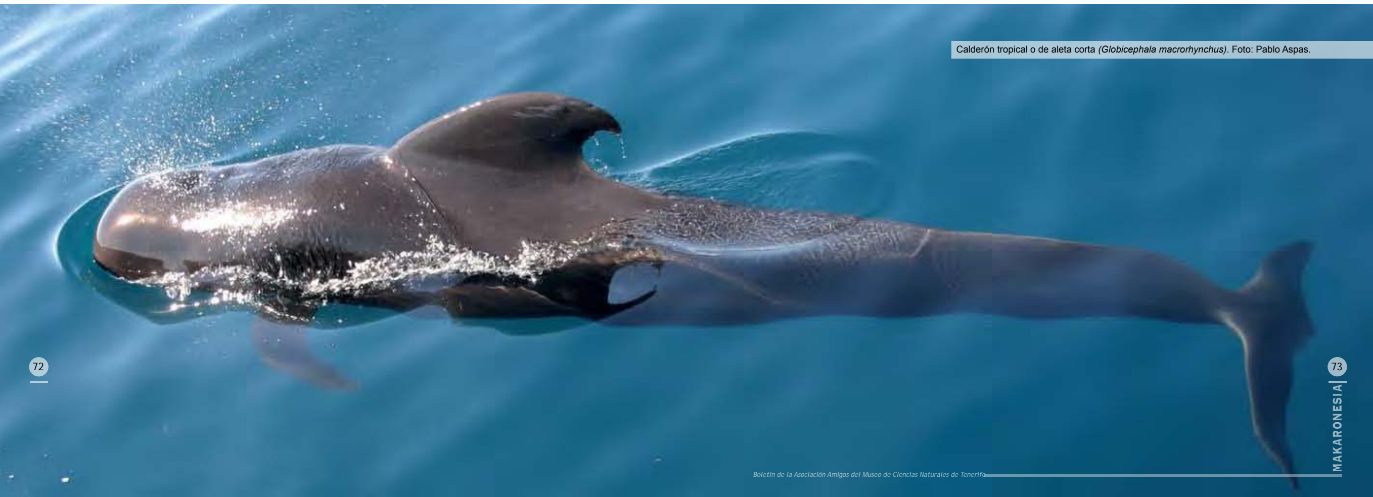
Calderón tropical o de aleta corta ( Globicephala macrorhynchus ).

que los cachalotes tengan más facilidad para extender la duración de las inmersiones que los zifios o los calderones, que son de tamaño medio. Este hecho es importante, pues los distintos retos fisiológicos a los que se enfrentan las especies pueden modelar su respuesta ante perturbaciones.