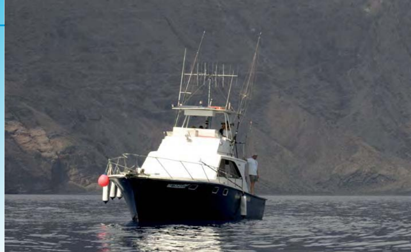
Embarcación utilizada para las campañas de estudio y marcaje de zifios en El Hierro.

Los zifios tienen un repertorio vocal limitado casi exclusivamente a chasquidos y zumbidos. Es sorprendente que, a pesar