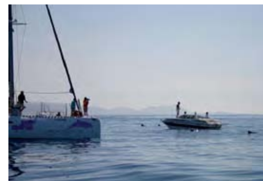
Observación de cetáceos en el suroeste de Tenerife por una embarcación turística dedicada a la observación y otra de tipo privado, que no respeta los 60 metros de distancia con los animales.

La cantidad de oxígeno que consume un individuo por unidad de masa indica su