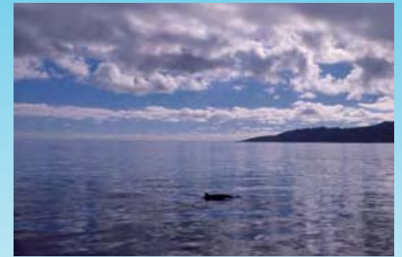
Panorámica de una de las áreas de estudio de zifios en El Hierro. Las Playas, mar de Bonanza.

ciones son imprescindibles para la supervivencia de los individuos y, por tanto, de las poblaciones. Por ello, la contaminación acústica es de gran importancia y sus efectos pueden ser tanto de enmascaramiento de las vocalizaciones como de cambios de comportamiento, afecciones fisiológicas y, en casos extremos, directamente letales.