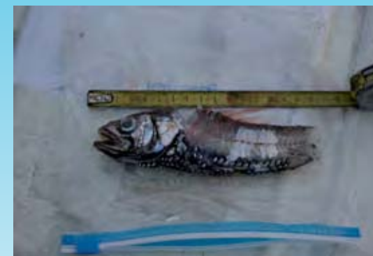
Posible presa de zifios. Se encontró mientras se seguía a un grupo de zifios en El Hierro.

nares de detección de submarinos, que emiten intensos pulsos acústicos en frecuencias medias, audibles para el ser humano. Vidal Martín, de la Sociedad para el Estudio de los Cetáceos en Canarias (SECAC), lleva recopilando información de varamientos desde la década de 1980, gracias a lo que se sabe que Canarias es uno de los lugares