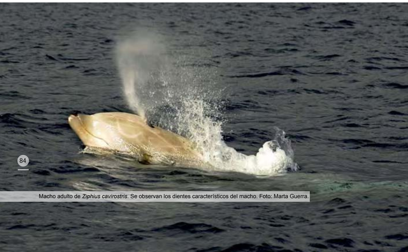
Macho adulto de Ziphius cavirostris . Se observan los dientes característicos del macho.

TYACK, P. L., M. JOHNSON, N. AGUILAR DE SOTO, A. STURLESSE & P. MADSEN (2006). Extreme diving behavior of beaked whale species Ziphius cavirostris and Mesoplodon densirostris . Journal of Experimental Biology 209: 4.238-4.253.