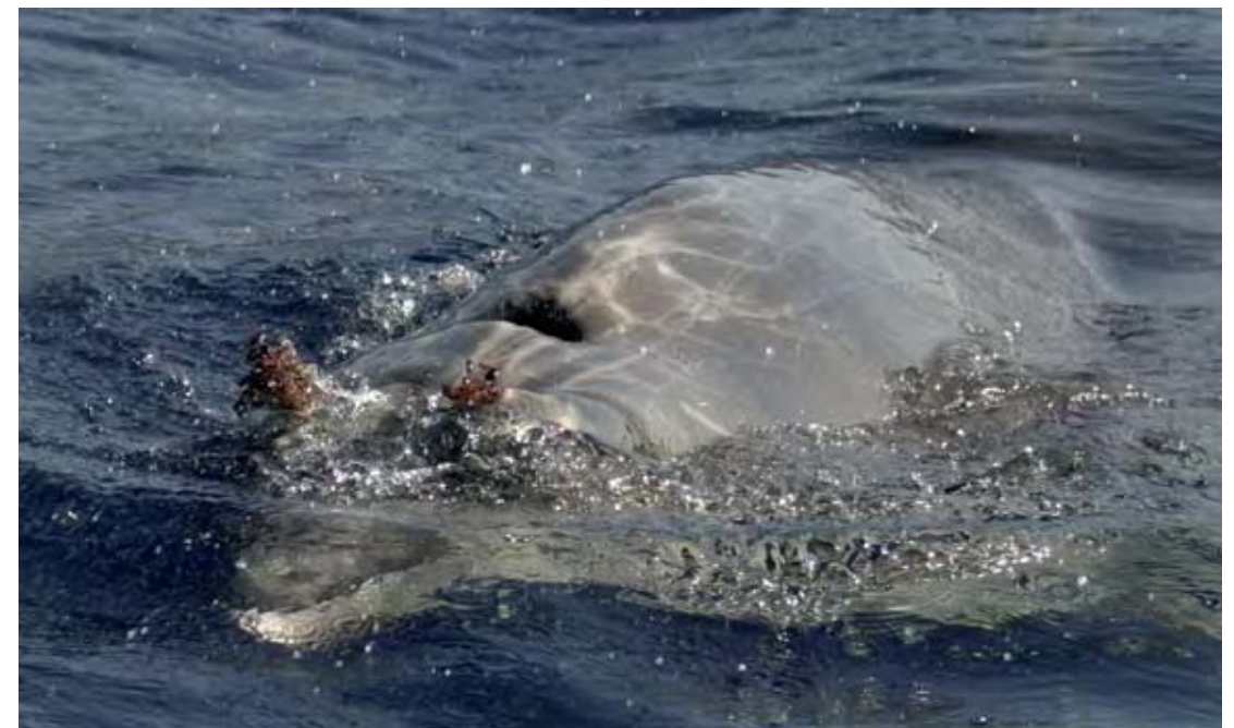
Macho adulto de Mesoplodon densirostris . El Hierro.

mos un ejemplo del posible impacto del ruido producido por el tráfico marino en un zifio de Cuvier marcado en el mar de Liguria (Italia). El paso de un barco de gran eslora coincidió con una de las ocho inmersiones de alimentación que realizó este zifio, incrementando el ruido ambiente en al menos 15 decibelios en las frecuencias ultrasónicas de los chasquidos del animal. Este hecho es sorprendente, por-