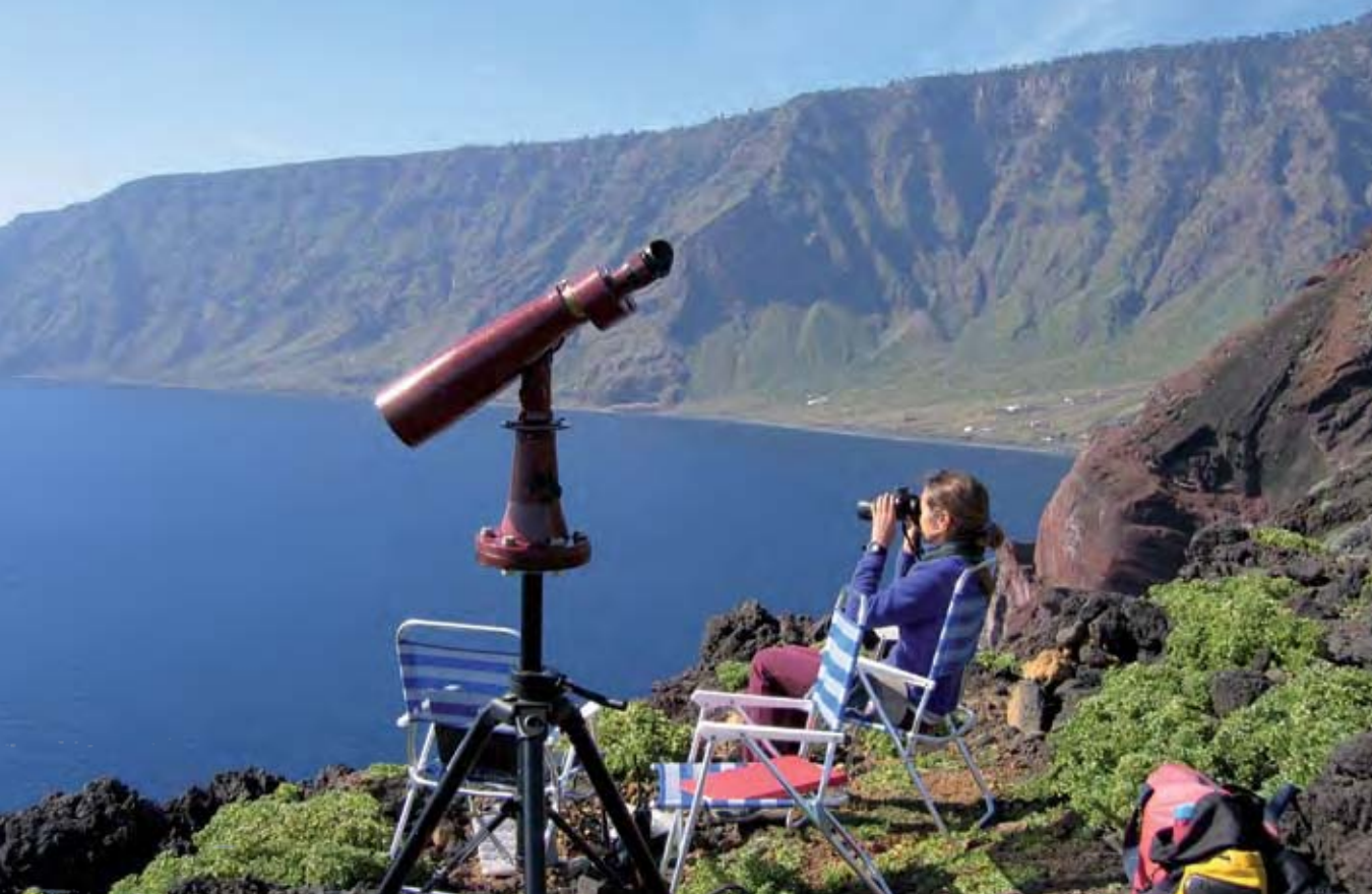
Estación en tierra para el estudio de las poblaciones de zifios ( Mesoplodon densirostris y Ziphius cavirostris). El Hierro, mar de Bonanza.