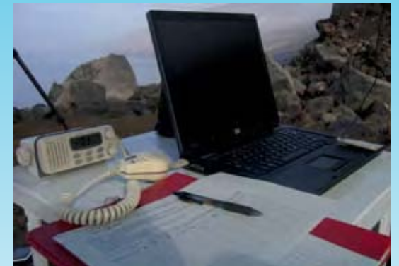
Parte del material de recogida de datos desde la estación en tierra para la localización y seguimiento de los zifios en El Hierro.

En cuanto a la conservación de las especies, desde los primeros varamientos masivos hasta ahora se ha evidenciado la relación de las mortandades de zifios con las maniobras navales, incluyendo el uso de sonares militares. En este sentido, se ha sentado un ejemplo internacional en Canarias, al declarar el Ministerio de Defensa una moratoria al uso de los sonares