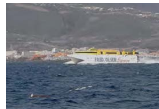
“Fast-ferry” atravesando la zona de residencia de las poblaciones de calderón tropical ( Globicephala macrorhynchus ) y delfín mular ( Tursiops truncatus ) en el suroeste de Tenerife.