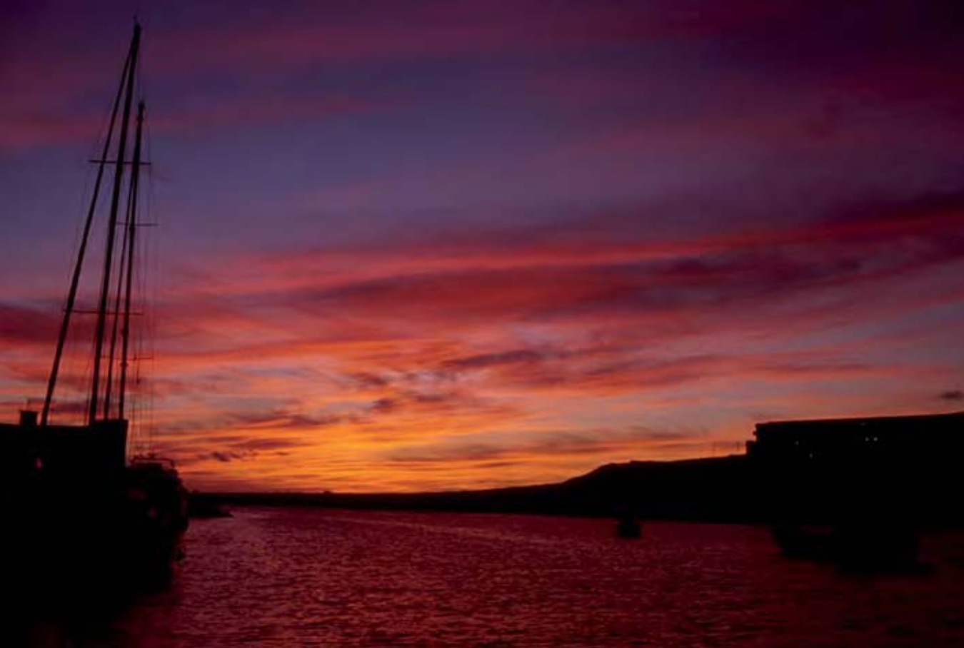
Atardecer en el muelle de La Restinga, lugar de partida para el estudio de los zifios en El Hierro.

consumo energético o tasa metabólica; el oxígeno es el combustible de la vida animal. Por tanto, para estimar la tasa metabólica relacionada con las actividades normales, en libertad, de zifios y calderones, se utilizó un análisis de respirometría, realizado en base al registro acústico de los soplos, combinado con sus movimientos en superficie y la distinta capacidad pulmonar de las especies. Los resultados concuerdan con los distintos comportamientos observados: los calderones consumen casi cuatro veces más energía por unidad de masa que los zifios de Blainville. Probablemente, las grandes diferencias observadas se relacionan con la necesidad de los zifios de ralentizar su metabolismo de forma extrema, con objeto de reducir el tiempo durante el que dependerán de vías anaeróbicas en sus largas inmersiones de alimentación. Por el contrario, los calderones necesitan un metabolismo “de alto