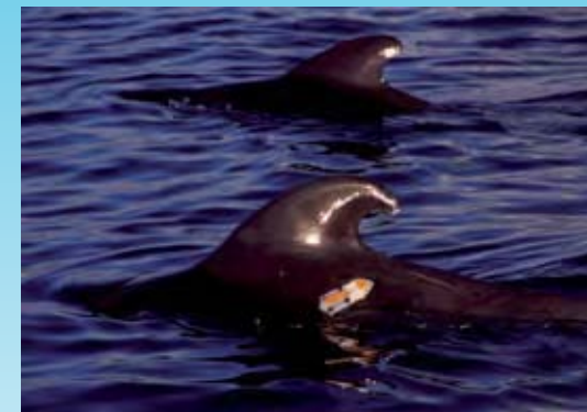
Globicephala macrorhynchus con DTag.

de oxígeno, tiene dos mecanismos principales para alargar el tiempo de inmersión y, por tanto, de búsqueda y captura de presas: aumentar su capacidad de almacenaje de oxígeno y reducir su consumo durante las inmersiones. En los mamíferos marinos el oxígeno se almacena principalmente en la sangre y los músculos, por lo que los individuos con mayor masa corporal pueden albergar una mayor cantidad de oxígeno. A ello se une que, en general, la tasa metabólica por unidad de peso se reduce al aumentar el tamaño de los animales (un elefante consume menos oxígeno por kilo de su cuerpo que una musaraña). La combinación de estos dos factores explica que, dentro de los mamíferos marinos, una mayor masa corporal tienda a incrementar la capacidad potencial de buceo. Por ello, es previsible