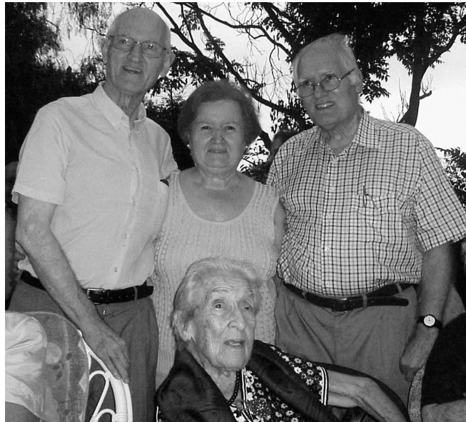
Amb els germans i la mare en celebrar aquesta els 100 anys (28 d'agost de 2006).