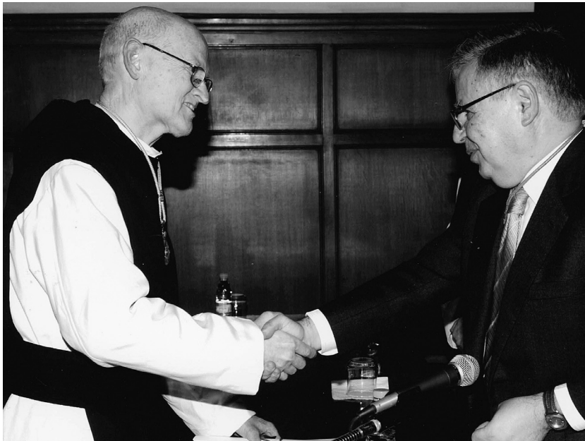
Felicitat pel president de la Reial Acadèmia de les Bones Lletres en rebre la medalla com a acadèmic