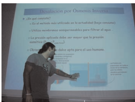
Figura 6. Imagen de las presentaciones orales del curso 2006–2007.