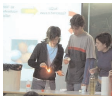
Figura 3. Imagen de las demostraciones realizadas en las presentaciones orales del curso 2004–2005.

De un modo programado previamente, ya se incluyó en la Guía Docente de tres asignaturas (Química General, Historia de la Química y Geoquímica y Mineralogía) la obligatoriedad de participar en esta actividad y su contribución en la evaluación global. Además, participaron también los profesores de Física, Enlace y Estructura de la Materia y Aplicaciones Informáticas para la Química, por lo que hubo claramente un enfoque multidisciplinar de los temas elegidos. La participación del profesorado se concretó en la selección de los temas propuestos, tutorización y seguimiento previos y evaluación del trabajo. Finalmente, se hizo también una presentación oral ante todos los profesores participantes.