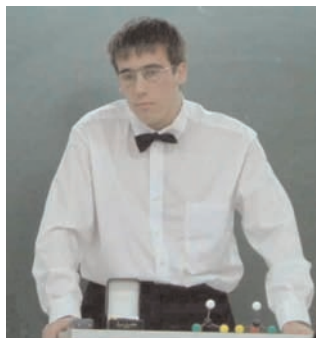
Figura 2. Recreación de la entrega del Premio Nobel al científico Van't Hoff durante las presentaciones orales del curso 2003–2004.