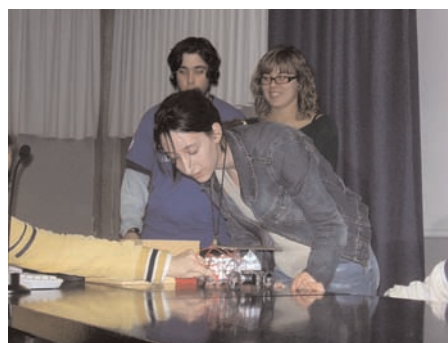
Figura 7. Demostraciones durante las presentaciones orales del curso 2006–2007.