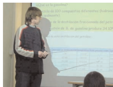
Figura 4. Imagen de las presentaciones orales del curso 2004–2005.