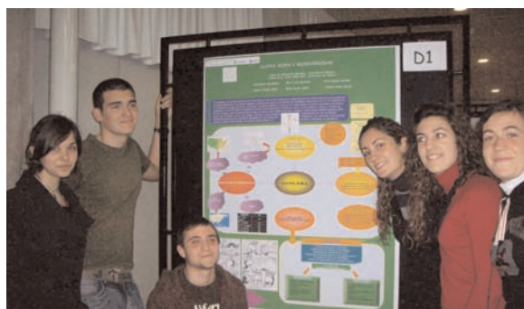
Figura 8. La "defensa a pie de póster" (curso 2006–2007).