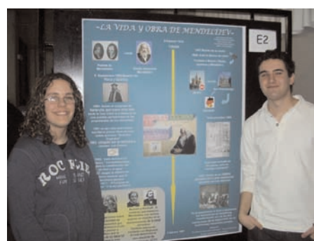
Figura 9. Otra imagen de la segunda sesión: la "defensa a pie de póster" (curso 2006–2007).