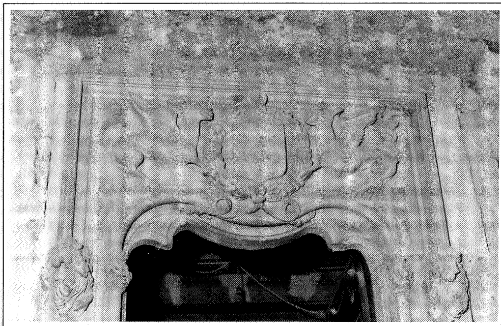
Figura 1. Armes dels Montanyans. Portal del pati de la casa que reformaren Nicolau de Montanyans (†1516?) i la seva dona Beatriu de Berard. Actual edifici del Sacristanat, Palma.