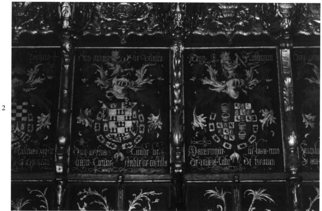
Barcelona. Catedral. Coro. Ornamentación heráldica repintada en el siglo XVII, para la celebración del XIX Capítulo de la Orden del Toisón de Oro.—1. Escudo de Carlos V.—2. Escudos del Condestable de Castilla y del Duque de Nájera.