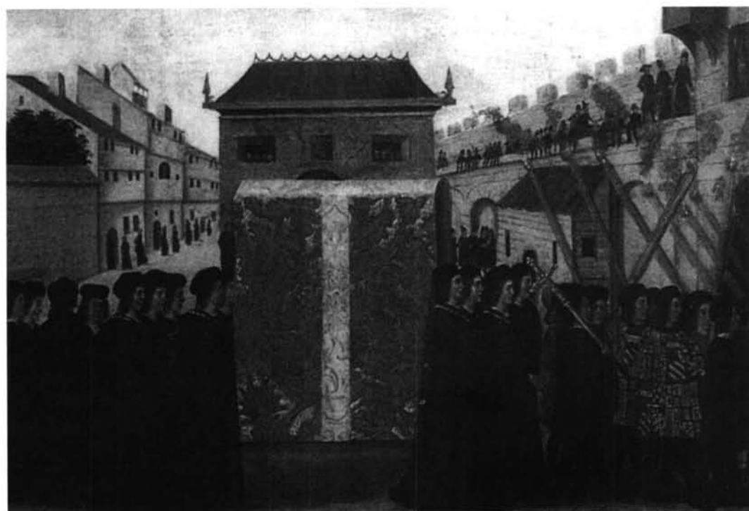
Ecaussines (Bélgica). Castillo de la Follie.-1. Encuentro de Felipe el Hermoso y Fernando el Católico en Remesal.-2. Entierro de Felipe el Hermoso en Burgos.