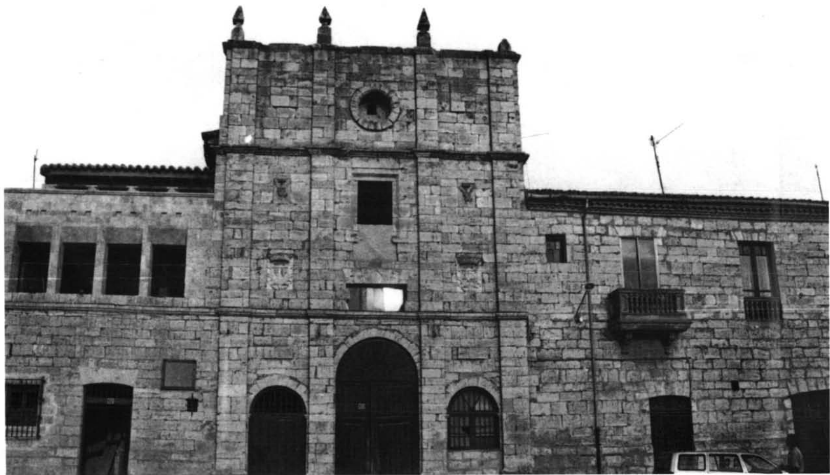
Toro. Iglesia del Monasterio de San Agustín. Fachada.