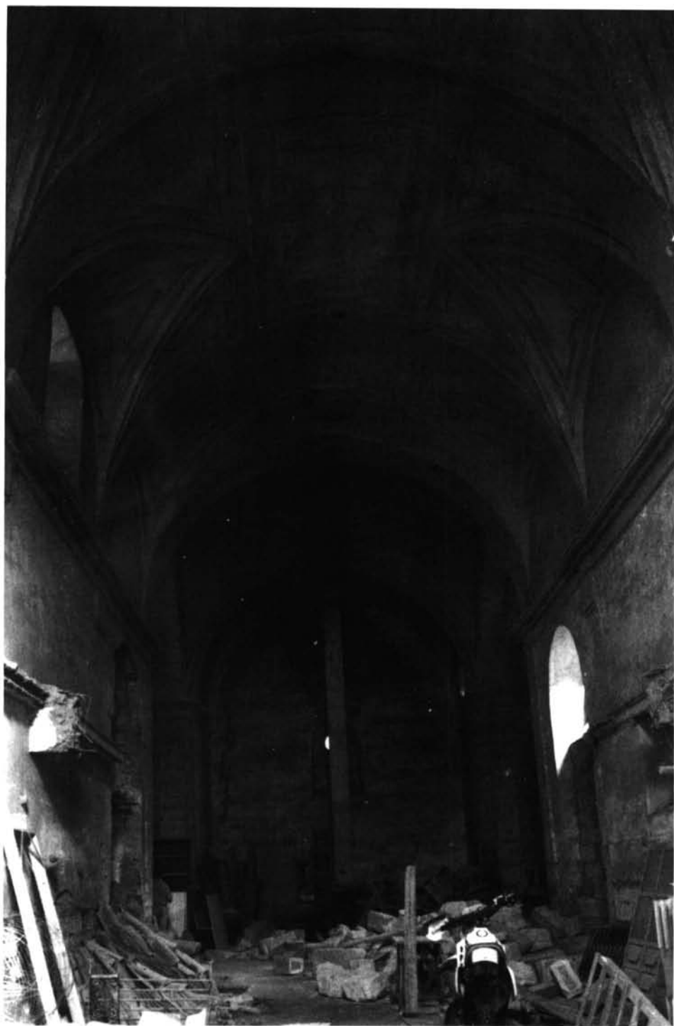
Toro. Iglesia del Monasterio de San Agustín. Interior.