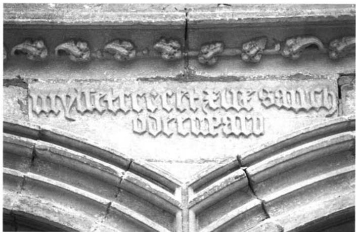
Guernica (Vizcaya). Iglesia de Santa María.—1. Portada.—2. Firma de la portada, por Sancho de Emparo en 1449.