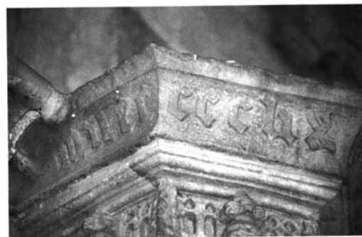
Elgoibar (Guipúzcoa), Iglesia de San Bartolomé de Olaso: 1. Portada.— 2. Autoría de Juan de Acha en la escultura de San Bartolomé.— 3 y 4. Firma y fecha de la portada: M. Sancho, 1559.