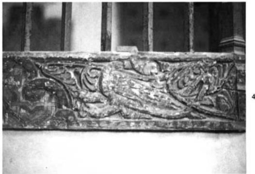
Salamanca. Catedral Vieja. Vigas mudéjares: 1. Vigas A y B.—2. Vigas C y D.—3. Viga B.—4. Viga A.