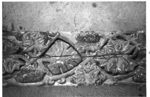
Salamanca. Catedral Vieja. Vigas mudéjares: 1. Viga C.—2. Viga C.—3. Viga C.—4. Viga D.