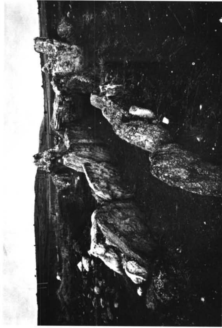
Sepulcro de corredor de Cubillejo de Lara.