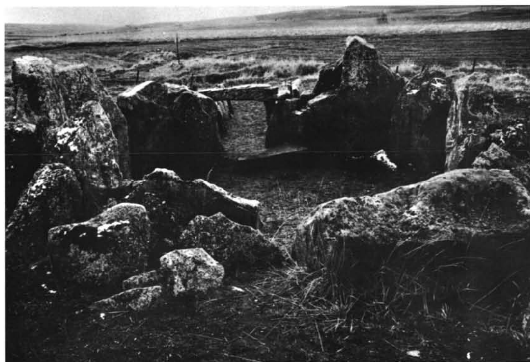
Sepulcro de corredor de Cubillejo de Lara.