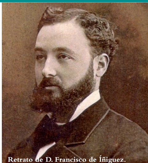
Retrato de D. Francisco de Iñiguez.

En 1899 salió a concurso la Dirección del Observatorio Astronómico de Madrid, siendo nombrado director el 4 de agosto. Ocuparía este cargo durante casi veinte años demostrando sus grandes condiciones de inteligencia y laboriosidad. Durante algún tiempo, las actividades del Observatorio Meteorológico estaban unidas al Astronómico y estuvo al frente de aquellas con notable eficiencia. En el Anuario del Observatorio Astronómico