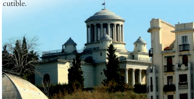
Observatorio de Madrid.

Por los trabajos realizados en relación con el eclipse de sol de 1900 le fue otorgada la Gran Cruz de Isabel la Católica y el Gobierno francés le premió con las Palmas Académicas. Sus fotografías sobre los distintos aspectos del Sol le hicieron alcanzar una categoría indiscutible.