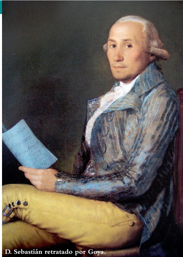
D. Sebastián retratado por Goya.

Experto en economía y finanzas, en 1791 se trasladó a Madrid al ser nombrado Tesorero Mayor del Reino. Allí conoció a Goya, con quien comenzó una amistad que llegó a ser fraternal. El pintor, enfermo, se trasladó a Cádiz en enero de 1793 junto a su amigo Sebas-