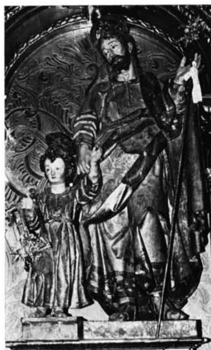
1. La Seca (Valladolid). San Basilio, por A. de Mondravía.—2. Palencia. Catedral. San Antolín, por J. de Rozadilla.—3. Valladolid. Iglesia de San Benito. Santa Teresa (antes Santa Isabel), por J. Imberto.—4. Segovia. Iglesia de la Fuencisla. San José con el Niño, por J. Imberto (?).