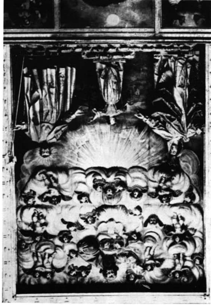
1. Paradiso desconocido, Sagrada Família, por J. A. de Estrada (?).—2. Calahorra (La Rioja), Carmelitas Descalzas, Sagrada Família, por J. Rodríguez (?).