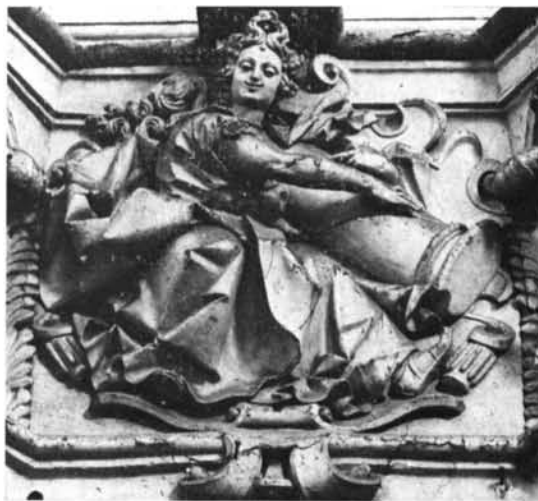
Salamanca. Iglesia de las Agustinas. La Fortaleza.