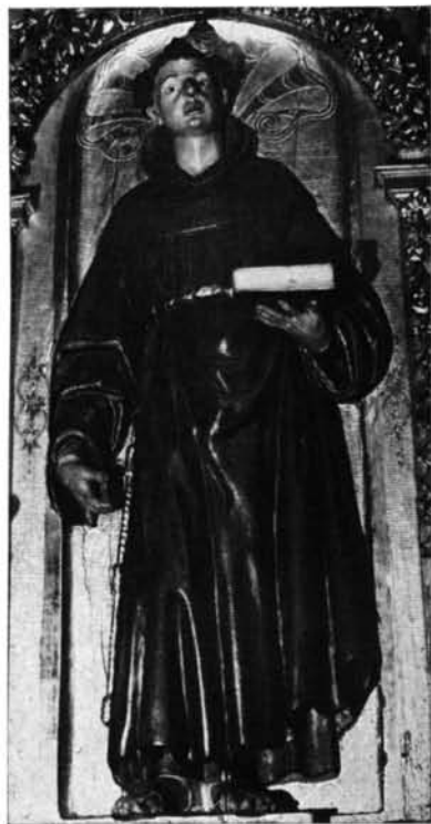
Salamanca. Capilla de la Vera Cruz: 1. San Benito de Palermo.—2. Santo franciscano.—Salamanca. Iglesia de San Martín: 3. San Francisco.—4. San Antonio de Padua.