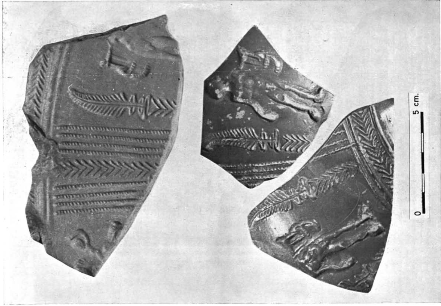
Alfar romano de Bezares.