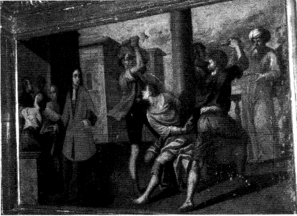
6. Pintor anònim: Martiri de santa Margalida, de la predel·la del retaule major de la parròquia d'Esporles.