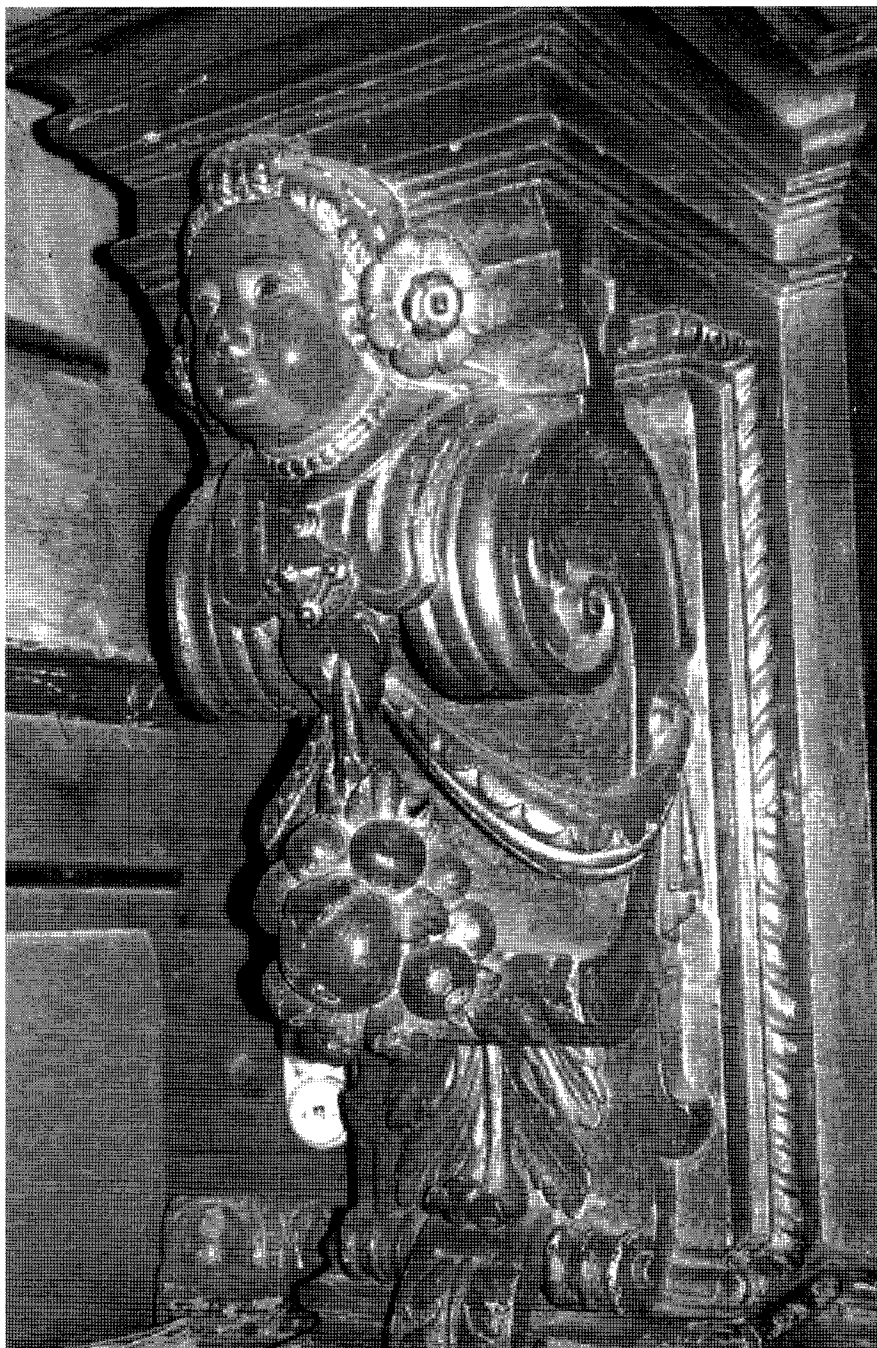
2. Joan Oms Bestard: àngel-mènula de la predel·la del retaule de santa Gertrudis. Palma, església de Santa Creu