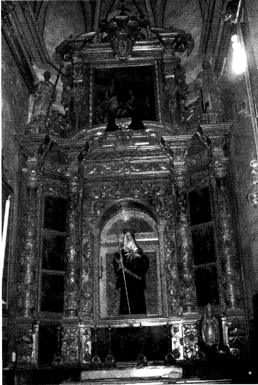
1. Joan Oms Bestard: retaule de santa Gertrudis. Palma, església de Santa Creu.