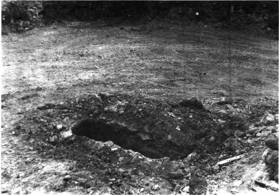
Foto 4. Panoràmica parcial del solar nº 38 de la Via Romana (Cau Partit), tras la destrucci3n de los restos arqueol3gicos. Ibiza, Mayo de 1986.

sistema de distribuci3n "a la parte" de los beneficios obtenidos por cada embarcaci3n, los ingresos por la venta de las 3nforas "pescadas" son un complemento de salario nada desdeñable para la economía de los pescadores.