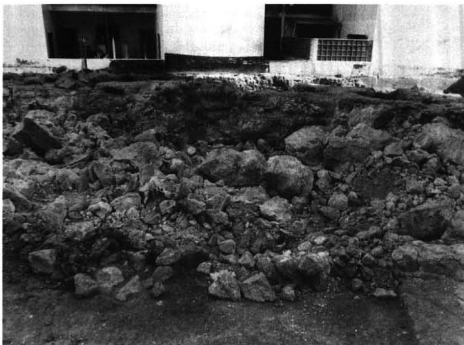
Foto 1. Pozos de acceso de dos hipogeos de la 2ª mitad del siglo VI a.C. descubiertos en las excavaciones de urgencia realizadas en el solar nº 10-12 de la C/ León (Necrópolis del Puig des Molins). Ibiza, Marzo de 1984.

plo la necrópolis púnica de Sa Barda ; que otros hayan quedado cubiertos casi por completo por modernas edificaciones, como Puig d'en Valls , y que otros se encuentren, en el mejor de los casos, cubiertos y ocultos, como el santuario púnico de S'Il·la Plana .