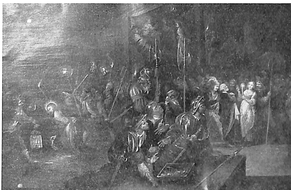
Palencia. Palacio Episcopal: 1. San Lucas pintando a la Virgen. 2. La negación de San Pedro.