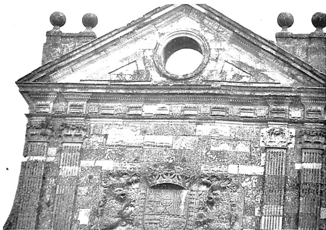
Sahagún de Campos (León). Iglesia del monasterio de San Facundo. Fachada principal (detalles).