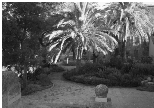
Vista del jardín. Estado 2005

transformado en aseos destinados al uso del público, y las habitaciones de las torres se han acondicionado para usos internos del museo.