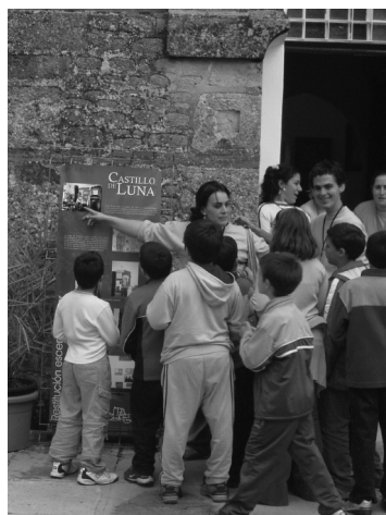
Visita de escolares a las jornadas de puertas abiertas de la Escuela Taller “Castillo de Luna II”. Octubre 2004

al ritmo de los trabajos, de este modo, las últimas se han centrado en las Casas-museo de personajes contemporáneos y afines a Jorge Bonsor conservadas hasta la actualidad 7 con el fin de contextualizar los trabajos que se vienen realizando y ayudar a los asistentes a conocer las singularidades de esta tipología museográfica.