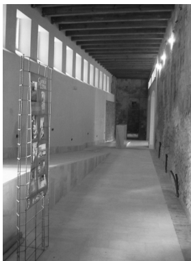
Nueva sala de exposiciones. Estado 2004