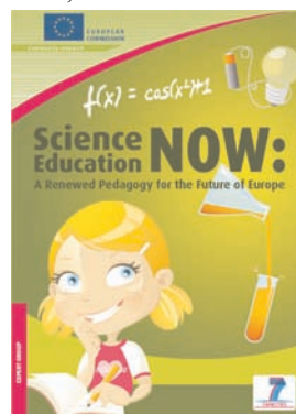
Figura 1. Portada del documento Science Education now: A Renewed Pedagogy for the Future of Europe . [12]

Por otra parte, en los últimos años, diversos estudios han resaltado una disminución alarmante en el interés de alumnos preuniversitarios por cursar estudios de Ciencias Experimentales y Matemáticas. A pesar de los numerosos proyectos y acciones concretas que están siendo aplicadas para acabar con esta tendencia, entre los que se puede destacar la celebración del Año de la Ciencia en España, [11] los signos de mejora son todavía poco optimistas. Además, entre la población en general, la adquisición de conocimientos científicos, en una sociedad cada vez más dependiente del uso del conocimiento, es un proceso que se encuentra también con importantes lagunas. Recientemente, en este sentido, la Comisión Europea encargó a un grupo de expertos, bajo la dirección de Michel Rocard, ex Primer Ministro de Francia, el estudio, desarrollo y gestión de iniciativas que puedan ponerse en práctica así como la elaboración de proyectos con el fin de provocar un cambio radical en el interés de los jóvenes hacia los estudios de Ciencias. Un primer documento, [12] cuya portada se muestra en la Figura 1, recoge las conclusiones y recomendaciones de este grupo de expertos, recogidas bajo el título de: "Science education now: a renewed pedagogy for the future of Europe". En resumen, el documento recomienda que los pro-