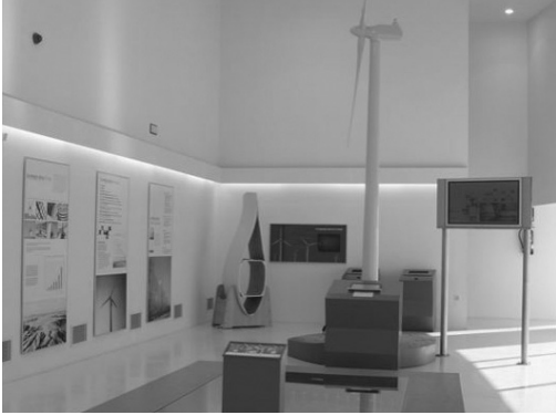
Figura 6. Museo del Viento de La Muela. Sala que alberga la maqueta del parque eólico y el aerogenerador interactivo.

Museos municipales en Aragón. Dos ejemplos: Zaragoza y La Muela