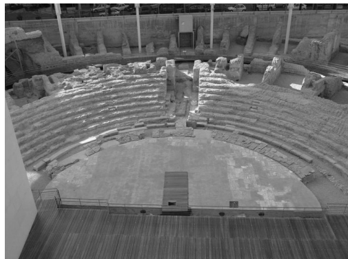
Figura 2. Vista del monumento del teatro de Caesaraugusta con el pavimento de la orchestra reintegrado en su lugar

Daba comienzo la etapa de elaboración de un discurso que diese sentido y coherencia al enorme esfuerzo que había supuesto para el