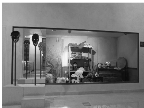
Figura 1. Vitrina con ambientación del atrezzo utilizado en las representaciones teatrales