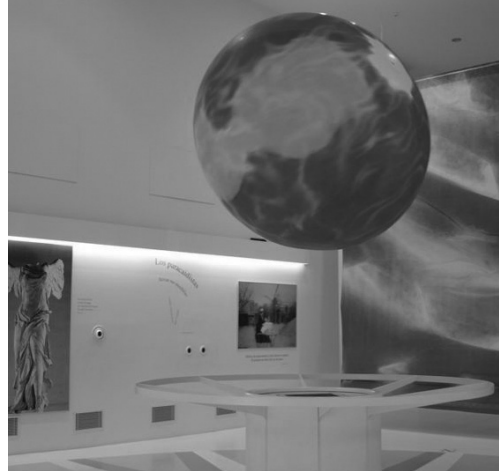
Figura 5. Museo del Viento de La Muela Sala introductoria

un espacio interior que favorece la delimitación, valoración y comprensión del monumento, permitiendo además una visita de calidad en condiciones más cómodas y placenteras. (Figura 2)