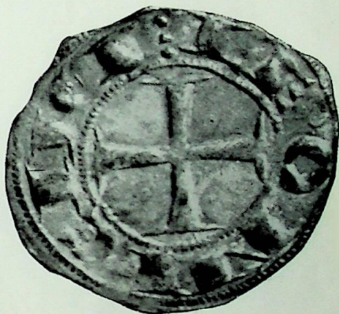
Lám. II.—1. Denario de Alfonso VII (a su tamaño).—2. El mismo ampliado tres veces.