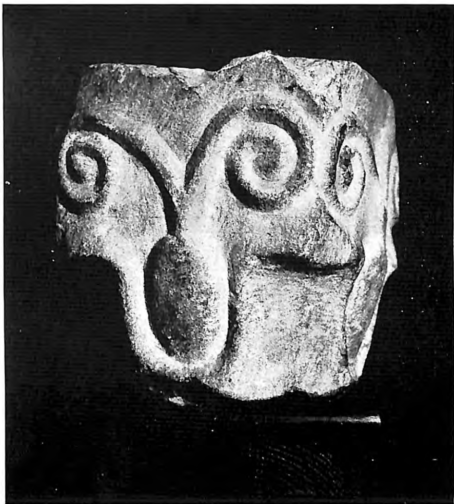
Capitel visigodo procedente de Pollos (Valladolid) de la colección de nuestro Seminario.