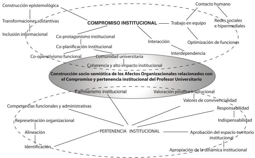
Figura 2: Afectos implicados con el compromiso y pertenencia institucional del Académico