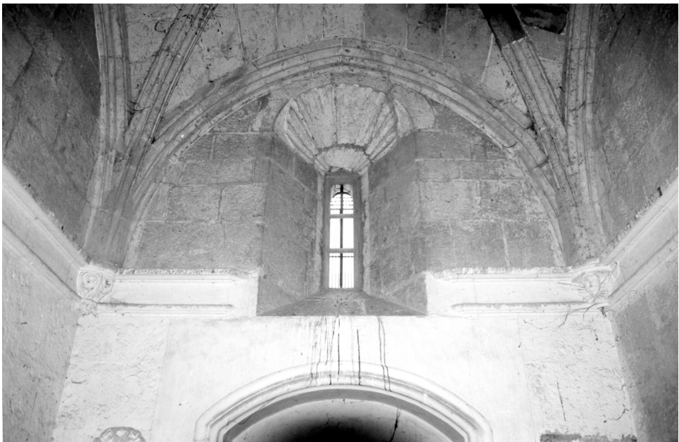
Figs. 5 y 6. Sacristía antes de la restauración.