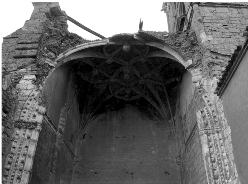
Fig. 3. Arco toral antes de la intervención.