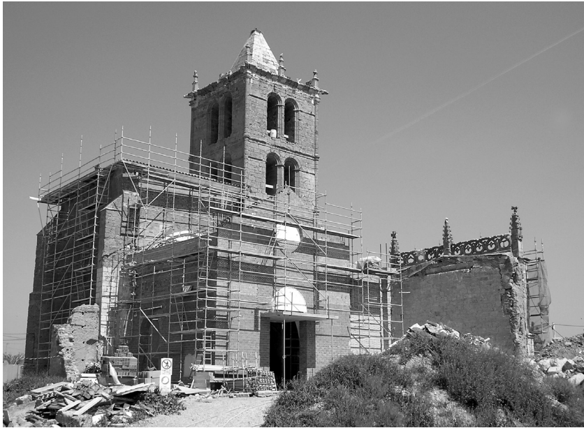
Fig. 8. Proceso de restauración.