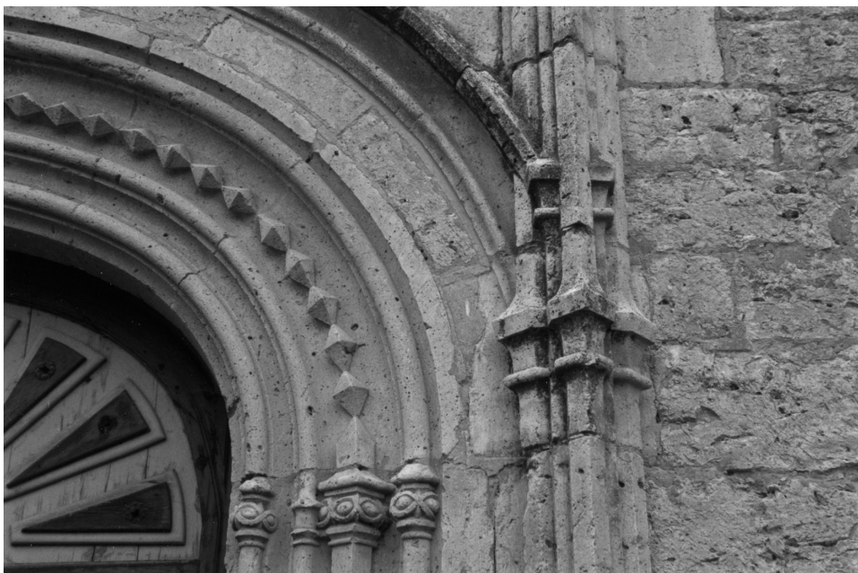
Fig. 10. Detalle de la portada principal.

Fecha de inicio-fin de las obras: 31 de agosto de 2005-19 de diciembre de 2006.