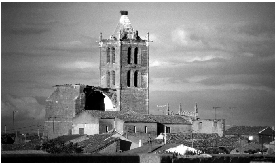
Fig. 1. Iglesia de Villar de Fallaves.

mayores. Únicamente quedaba en pie la capilla mayor, en lamentable estado de ruina, la torre y parte del muro sur. Tras el hundimiento, con más buena voluntad que criterio, el Obispado construye en 1963 una dependencia a modo de capilla sobre el espacio de la planta del primitivo templo, pero reorientándola 90° sobre la portada sur, que se mantuvo en pie. Ese espacio fue el lugar de celebración parroquial, hasta que a mediados de los años 90 se cierra definitivamente ante nuevo peligro de ruina. La ínfima calidad de sus materiales, unida, fundamentalmente, a los problemas de cimentación del templo, clausuraron definitivamente este lugar, trasladando el culto a la ermita del Cristo de la Vera Cruz, en el cementerio de la localidad. Con las obras de rehabilitación se quiere volver a dotar a la localidad de un espacio de celebración de nueva planta que surja de las ruinas perfectamente consolidadas del primitivo templo.