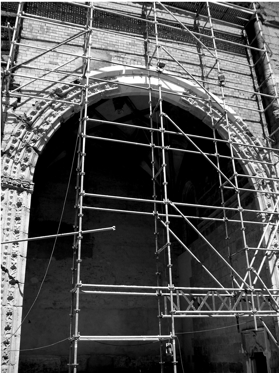
Fig. 7. A partir del arco triunfal emerge el nuevo cuerpo del templo.