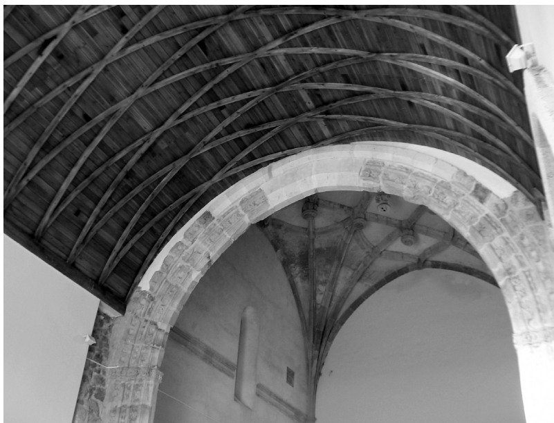
Fig. 3. Arco toral después de la intervención.