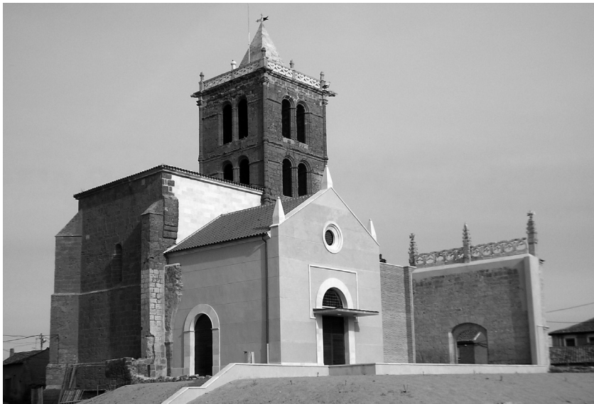
Fig. 9. Resultado final tras la intervención.