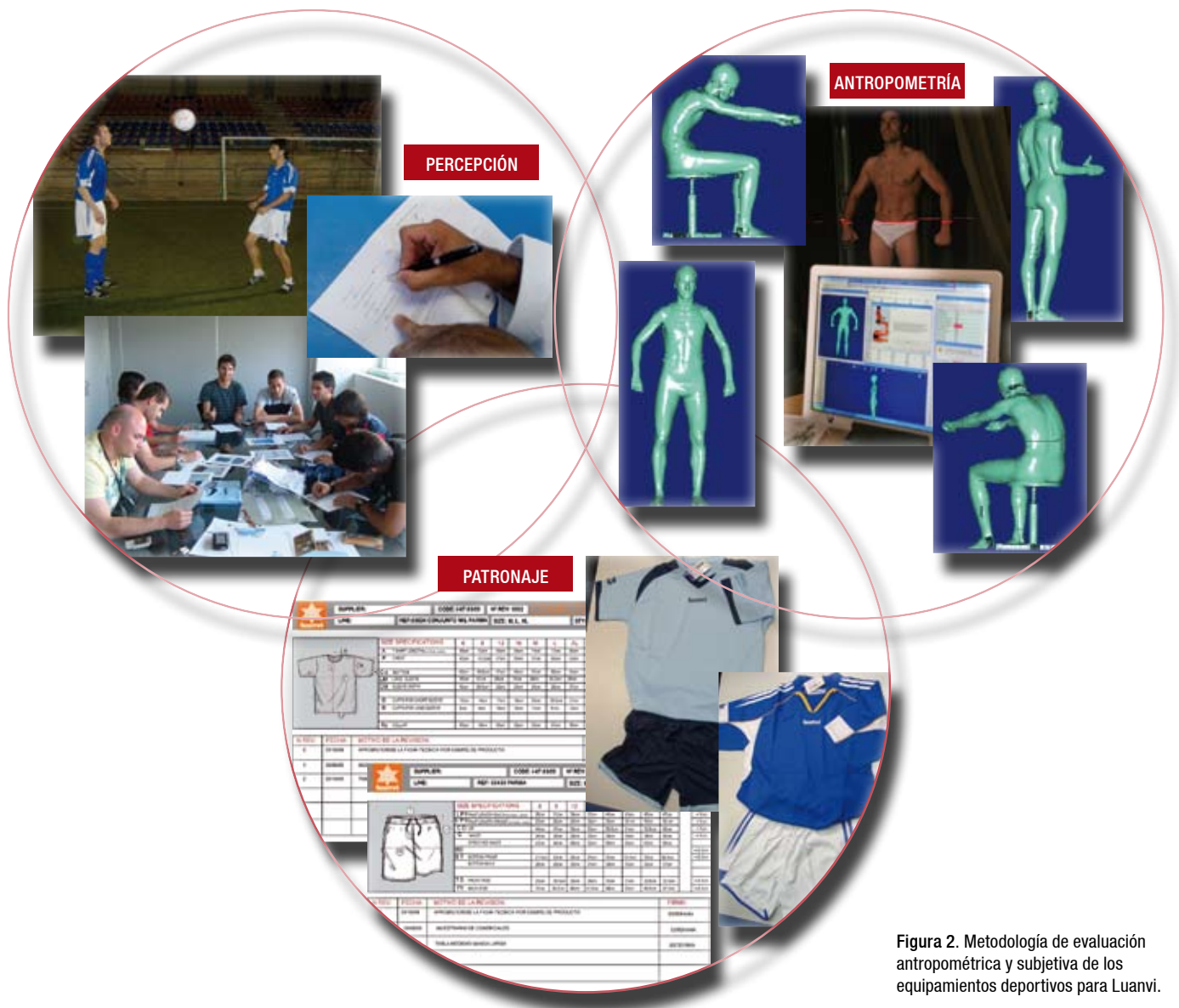
Figura 2. Metodología de evaluación antropométrica y subjetiva de los equipamientos deportivos para Luanvi.

La evaluación subjetiva de las prendas consistió en analizar la percepción del usuario relativa al confort, ajuste y usabilidad mediante el empleo de cuestionarios. Su objetivo es recabar información sobre las preferencias de los usuarios en