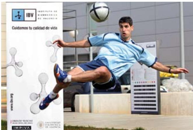
Figura 1. Pruebas de valoración biomecánica realizadas en el IBV.

En el artículo que se presenta se describe el trabajo realizado para la empresa valenciana LUANVI, fabricante de prendas deportivas. Este proyecto ha permitido comparar los patrones utilizados con las dimensiones antropométricas características de los jugadores de fútbol, así como obtener la percepción de los usuarios para traducirla en mejoras del producto.