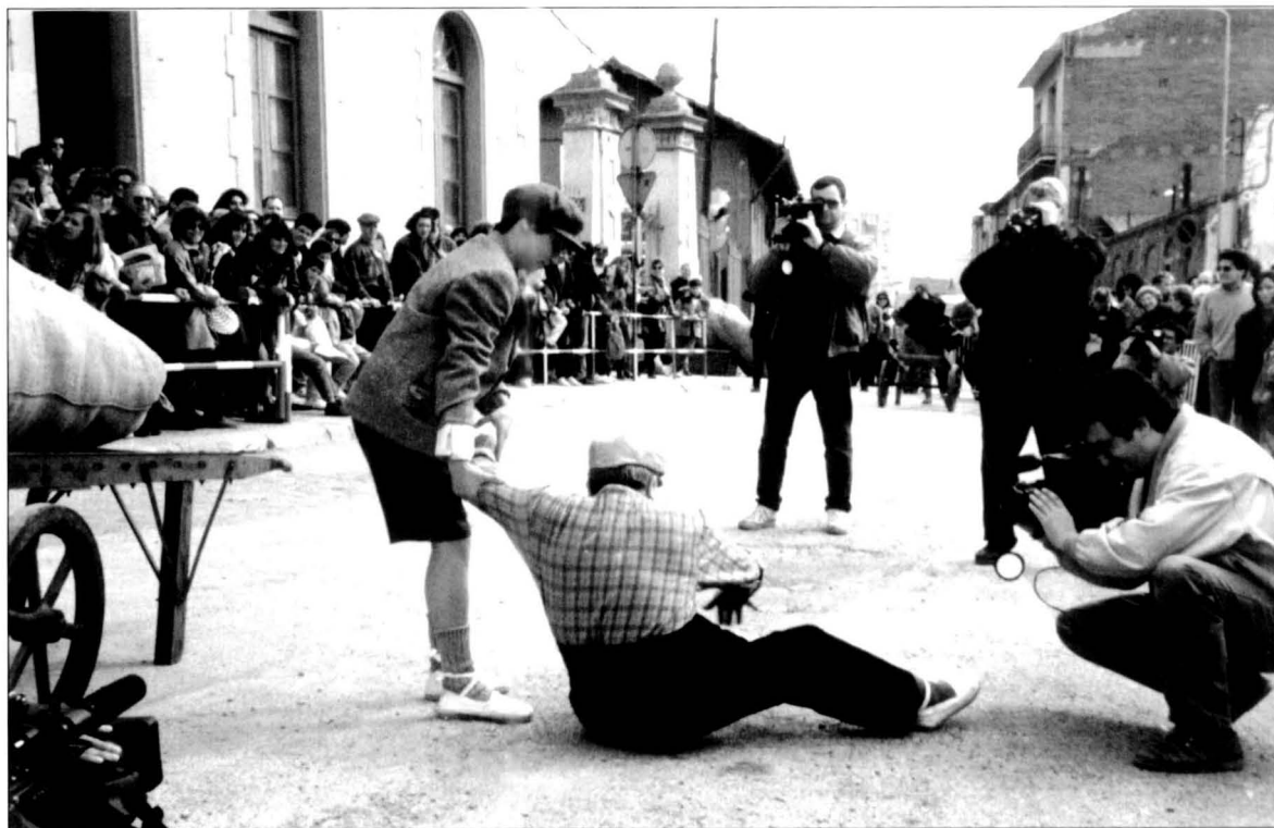
Títol: "Carregant bales de llana".

Però evidentment, en el nostre cas, i per molt que hi hagués un públic entès com a tal (que "assisteix") –de fet es van inscriure les cent persones que havíem establert com a sostre–, aquí calia comptar amb un altre públic que era el que "fabricava" allò que s'oferia: des de la fàbrica que va preparar les bales de llana fins al Condicionament, que va preparar l'escena i l'explicació amb el material de l'època, la fàbrica que va engegar els telers en diumenge, el forner que va fer els llonguets i va obrir la botiga, l'herbolari, la policia que va tallar el