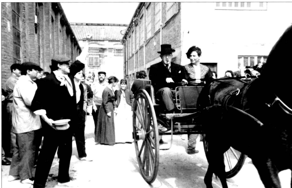
Títol: "Salari digne, menys hores de treball!".

un fil escènic amb contingut de diàlegs i representació teatral. Els escenaris de la jornada es varen complementar amb objectes de l'època, dels fons dels dos museus i de propietat privada, i també amb el vestuari dels actors i els carruatges. Els diàlegs van ser elaborats per Lluís Baron i "la seva gent" de teatre, a partir del material que des dels dos museus li vam preparar i que recollia els elements principals de la vida quotidiana del moment (electricitat en instal·lació, pujada dels preus, el boom de la feina en ocasió de la primera guerra mundial, l'edat laboral, els sous i les hores de treball, etc.).