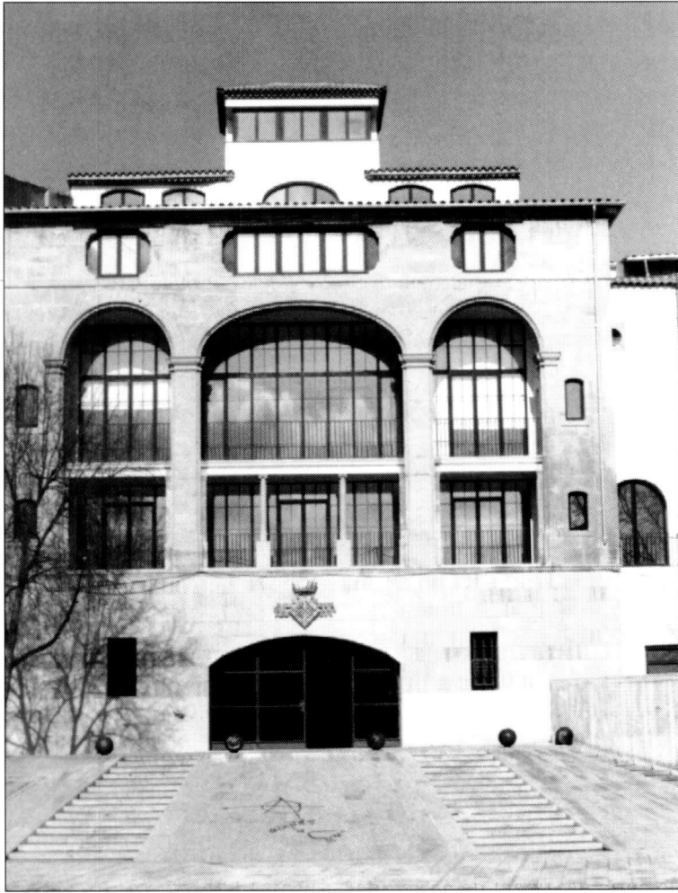
El gran casal de la família Terés, edificat per Marià Terés i Pasqual entre 1820 i 1828. Actual seu del Consell Comarcal de l'Urgell.

a un petit estudi d'història local, que vol defugir, doncs, la mera erudició localista, molt sovint estèril dins la nostra producció historiogràfica.