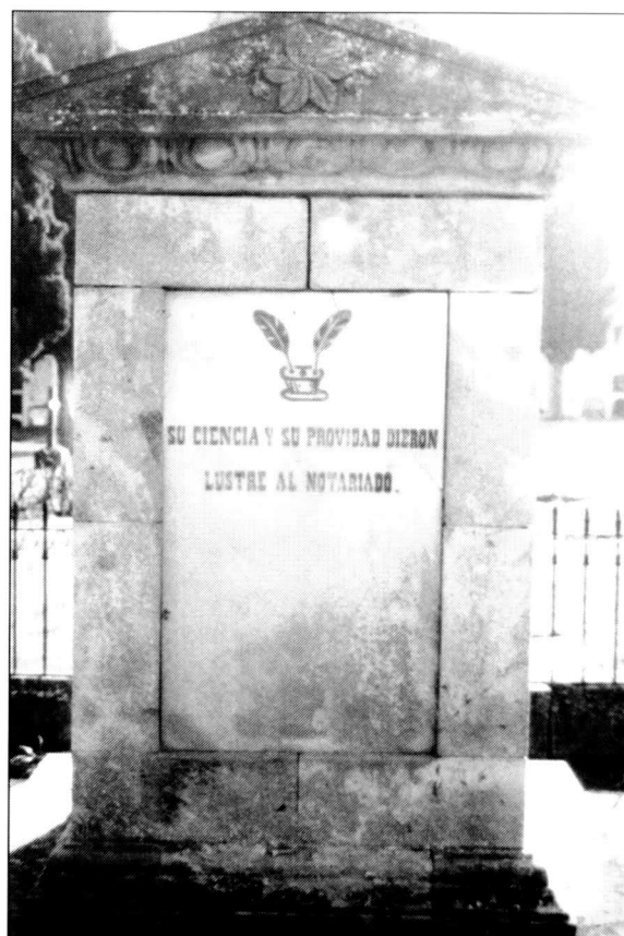
Detall del panteó de Marià Terés i Pasqual, en què es lloa la seva dedicació al notariat.