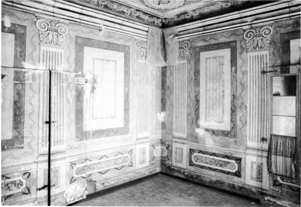
Vista parcial d'una de les sales nobles de la primera planta de Cal Perelló.