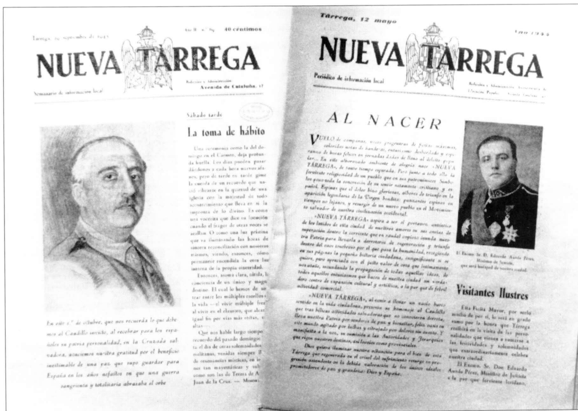
Portada del primer número de Nueva Tarrega (12 de maig de 1944). Part dreta. A l'esquerra il·lustració típica de Franco que utilitzava Nueva Tarrega per a felicitar el Caudillo el dia de la seva honomàstica o bé en els aniversaris de l'entrada de les tropes franquistes a Tàrrega. (Reproducció: Jesús Vilamajó)

El propòsit del nostre treball és apropar-nos als continguts que marcaven la pauta i donaven contingut a la N.T. dels anys 40. Veure quines eren les qüestions tractades amb major profunditat. Per dur a terme el nostre objectiu, hem utilitzat els tres aspectes, a parer nostre, que millor defineixen la revista. Aquests tres paràmetres són: la portada o primera pàgina de la publicació, els editorials i les seccions fixes d'opinió, redactades pels col·laboradors habituals. Damunt d'aquestes bases recolzarem les nostres anàlisis sobre la trajectòria informativa i ideològica del setmanari editat a Tàrrega en el decurs de trenta anys d'autocràcia.