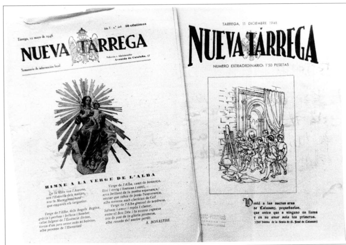
Portades de Nueva Tarrega dedicades a temes religiosos i educatius.

L'any 1946 el setmanari targarí "(...) besa reverente y humilde el anillo pastoral del nuevo Obispo [el Exmo. y Rdm. Dr. D. Vicente Enrique Tarancón] impetrado del Divino Hacedor derrame sus bendiciones sobre el neo-ungido en esas tierras de Levante, de Oriente, para que sea la luz que guie segura a sus ovejas havia el redil de la paz y del amor, en vida espiritual fecunda y decidida " 42 .