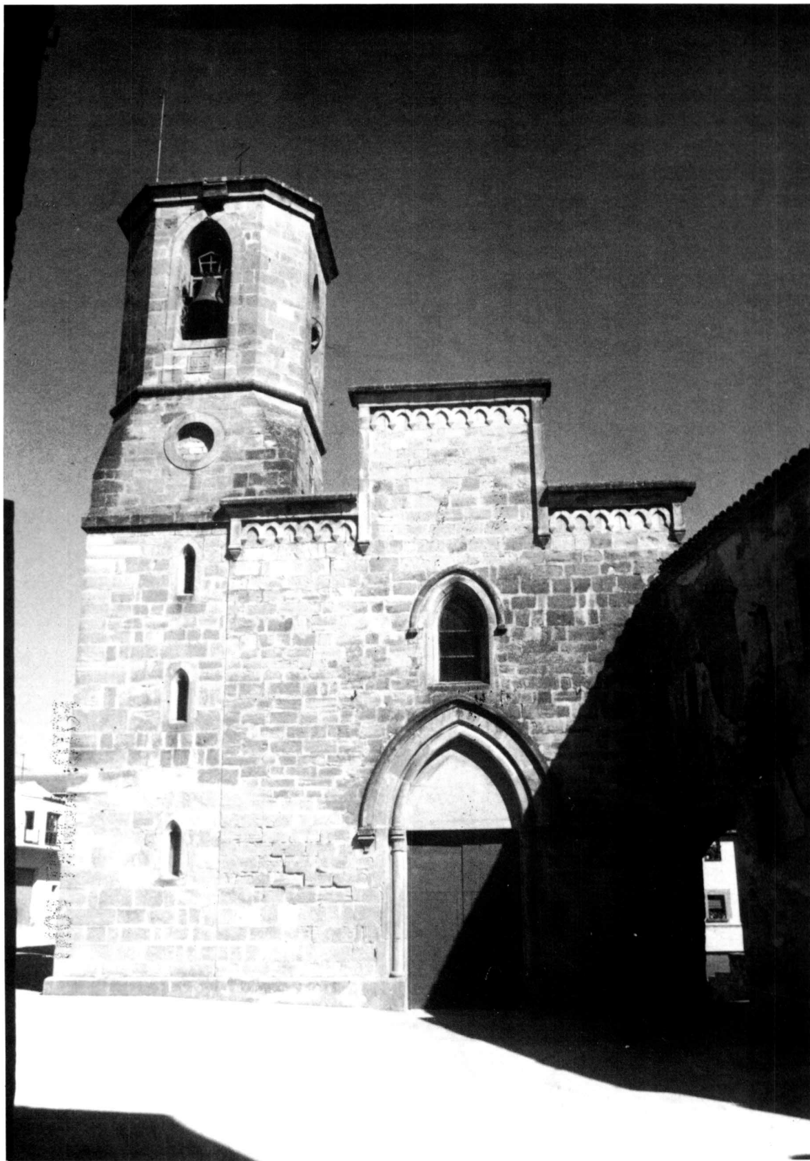
Vista de la façana de l'església parroquial de St. Llorenç.