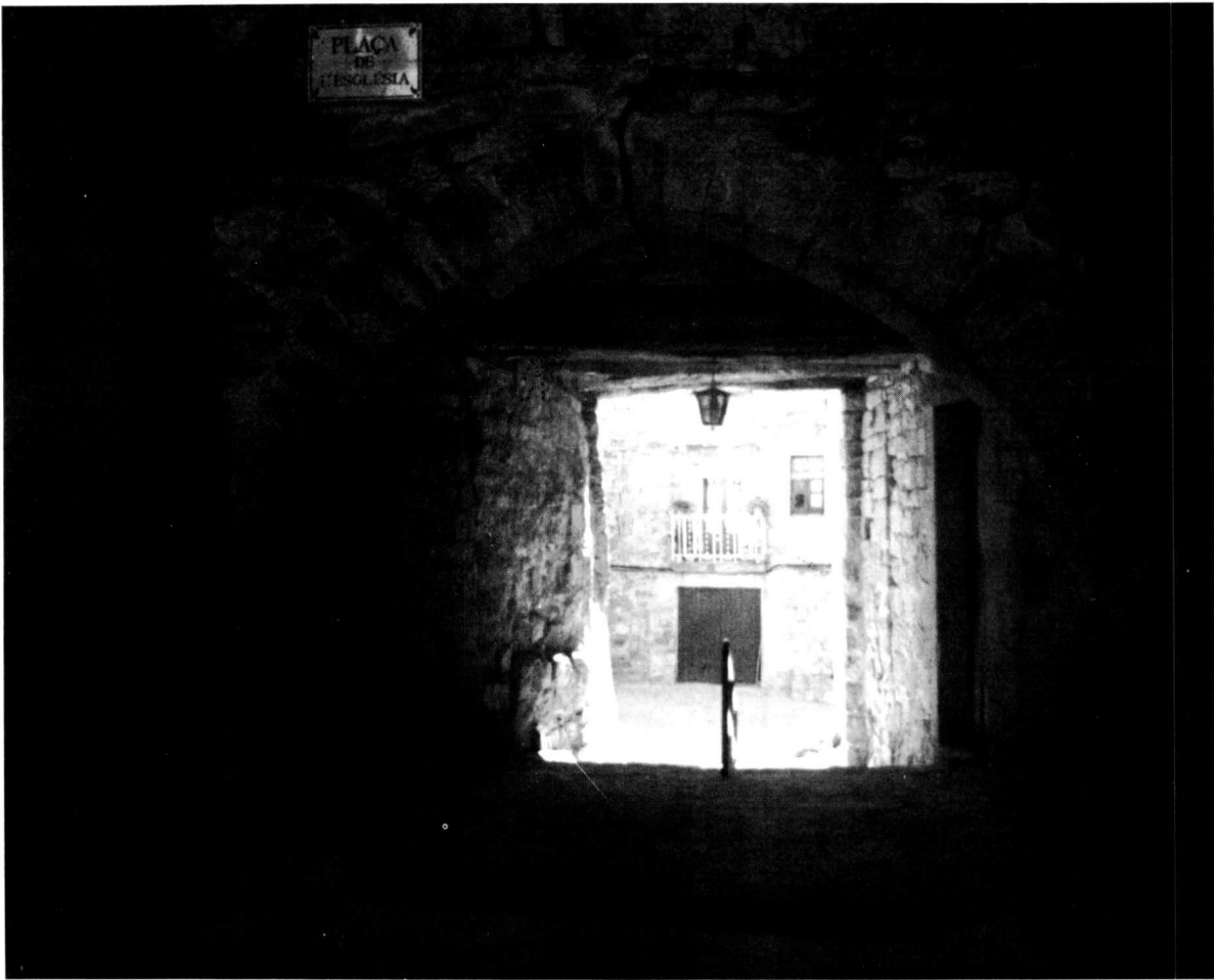
Vista parcial d'un pas cobert que dona a la Plaça de l'església.

No és la nostra intenció parlar de les tècniques de conreu, però com bé diu Núria Sales la distribució dels conreus està en relació directa amb les pràctiques agràries 20 .