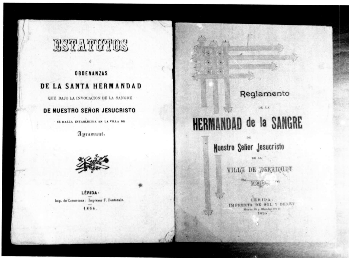
Portades dels estatuts i reglament de la Germandat de la Sang.

Era un problema de mal resoldre i cal pensar que ho anaren solucionant sobre la marxa de la millor